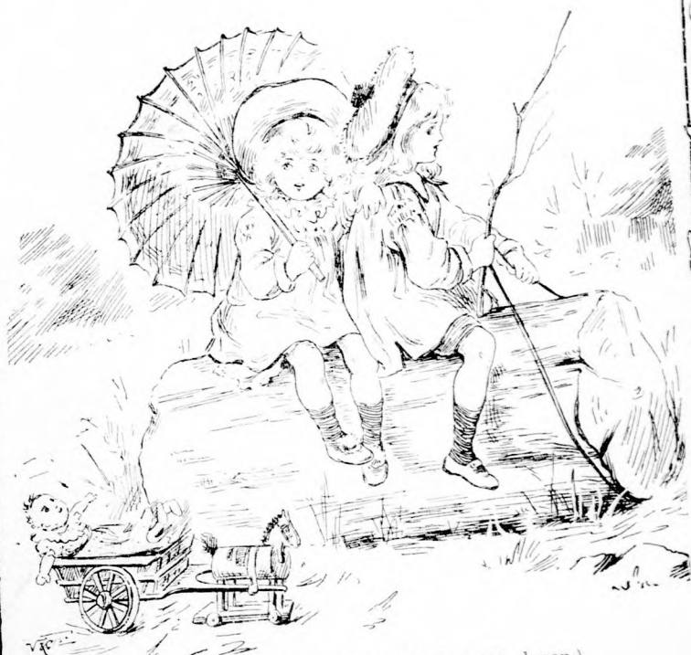
EL A VIRÁG-LAKZIBA! (Lásd a 311. lapon.)