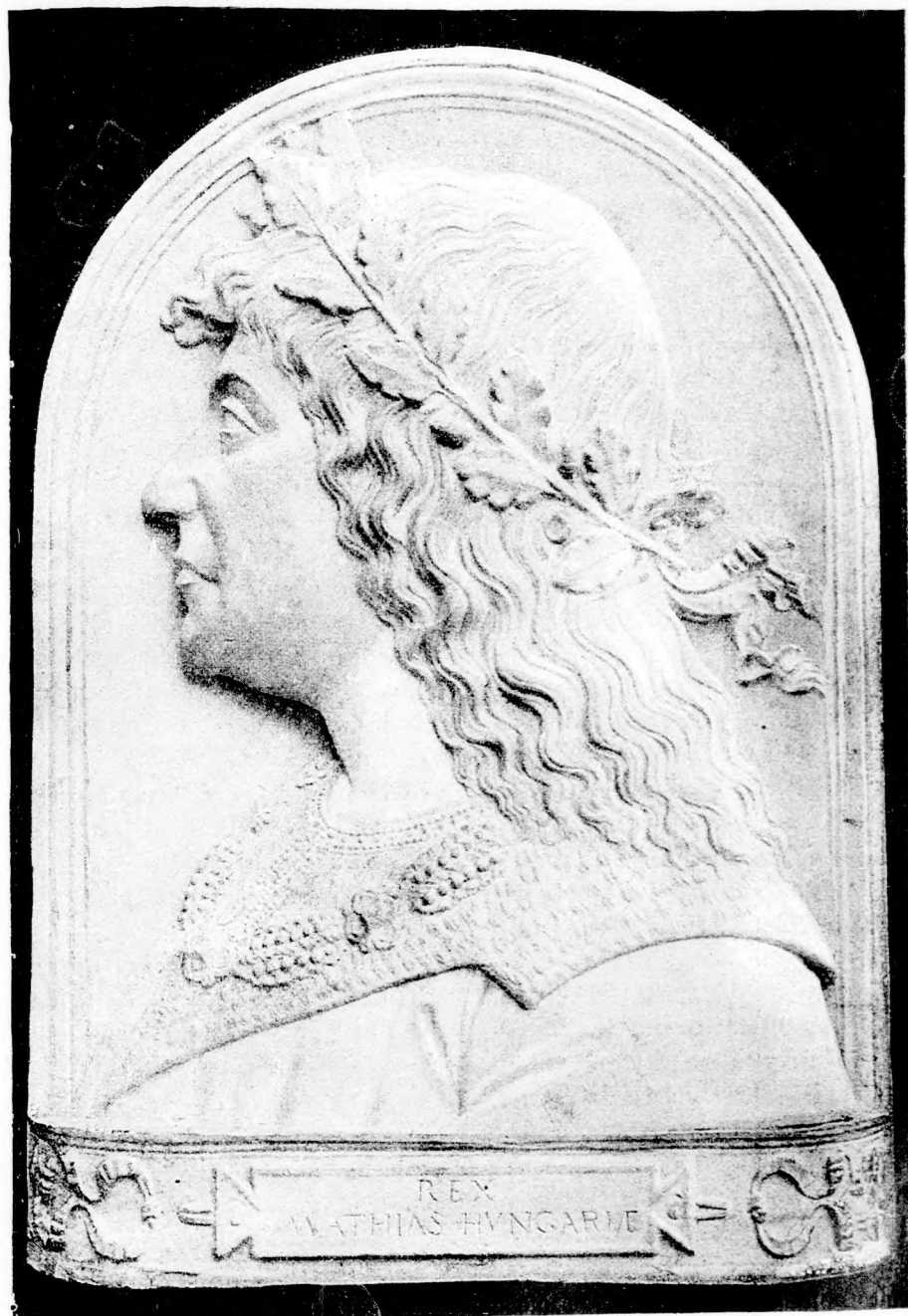
MÁTYÁS KIRÁLY. (Lásd a 314. lapon.)

s arczot örömtől avárában llt ugyan s király