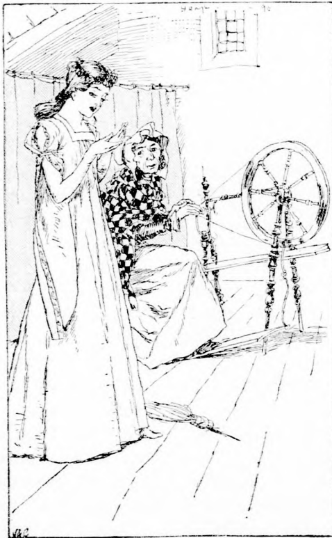
. . . VÉRZIK AZ UJJAM!

A szakács (kétségbe esetten.) Várni, várni! Én istenkém, jó istenkém! Tönkre men-