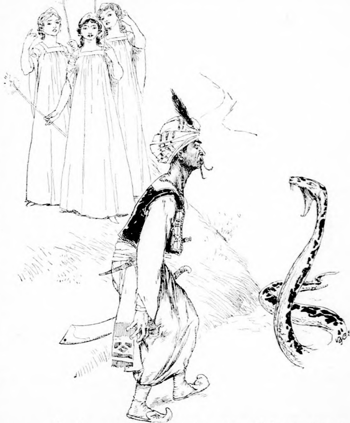
... ÓRIÁS KIGYÓ EMELKEDIK FÖL. (Lásd a 22. lapon.)