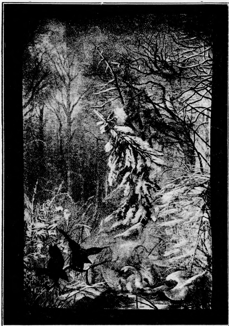
VISSZA VERT TÁMADÁS. (Lásd a 39. lapon.)

külső országgal és így a nagy reményekkel megindított gyűjtemény hetek múlva is csak olyan szerény volt, mint az első napokban.