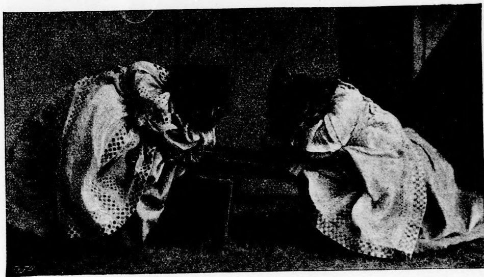
... FESZÜLTEN LESVE NÉZTEK. (Lásd a 39. lapon.)

ebben a pillanatban dühös vijjogással ott termett az anya-holló és vakmerően neki támadt a fészke megrablójának. Berti ijedten eresztette ki kezéből a kis madarat, mely lezuhant a magasból. Aztán szaporán menekült Berti, mert a holló veszedelmesen vagdosott a szeme felé. Gyorsan csuszott le a fán s mire lejutott a földre, mind a két kezéből patakozott a vér, az