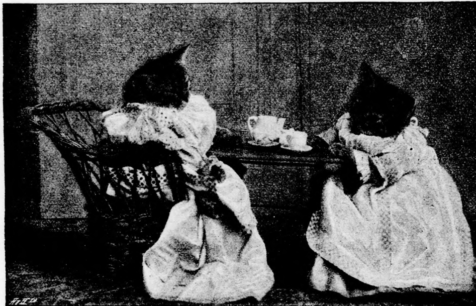
... JÓIZÜEN ELCSEVEGTEK. (Lásd a 39. lapon.)

Kigyalogoltak tehát az erdőbe, ami hatalmas séta volt. De hát aki becses tudományos gyűjteményt akar össze szerezni, annak nem szabad a fáradozástól megijednie. El is jutottak a fához és csakugyan látni lehetett a jókora fészket fenn a magasban. Bertin azonban gyanakvólag nézett Kántor Józsiára. Erre a fára fölmászni nem tréfa dolog.