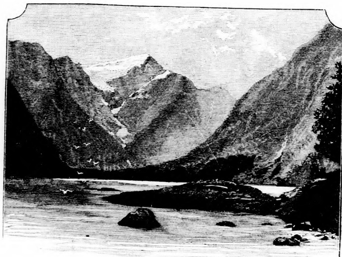
TENGERSZEM. (Lásd a 153. lapon.)