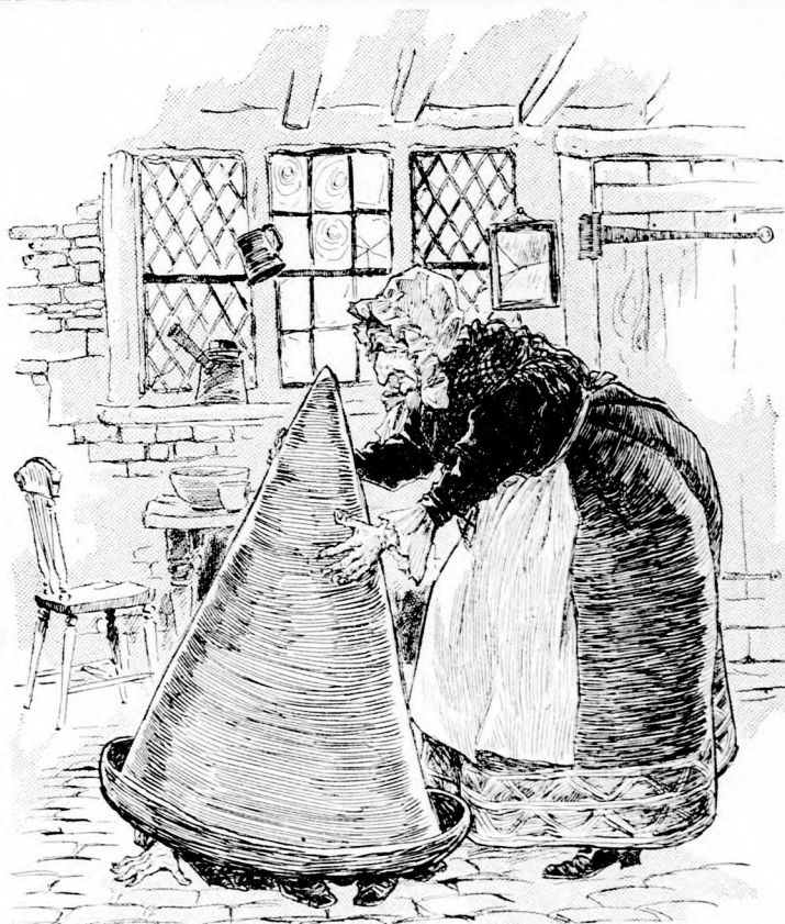
... LEBORITOTTA A SÜVEGGEL. (Lásd a 149. lapon.)