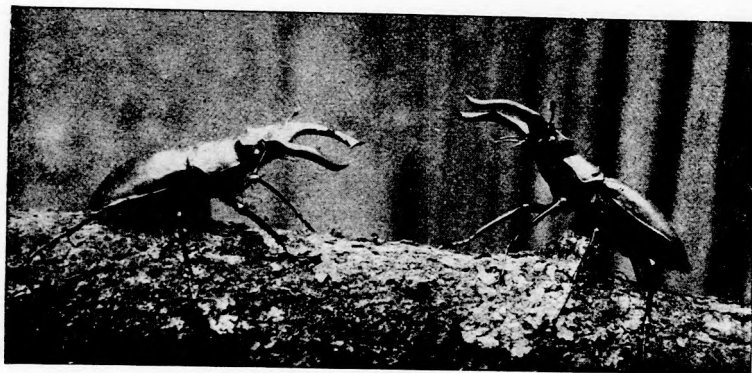
ERŐS ELLENFÉLLEL ÁLLTAM SZEMBEN.

csápjait, két első lábának szőrös részével szaporán végig kefélgette, hogy szinte ragyogtak.