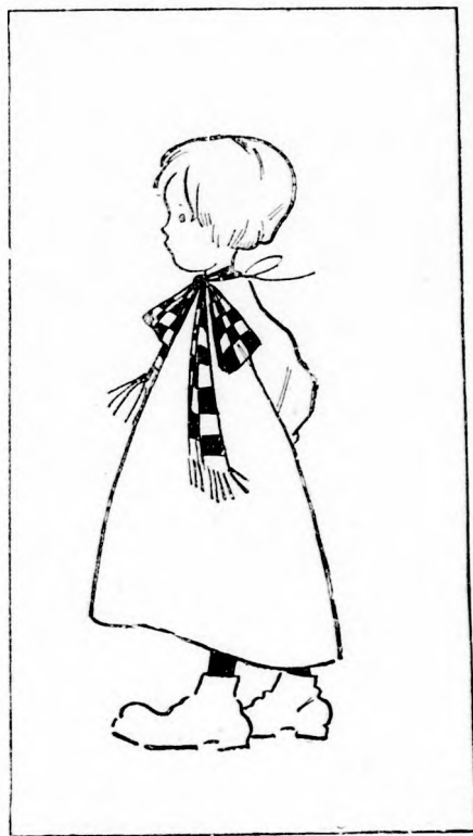
TERESIKE. (Lásd a 151. lapon.)

— Mondom, hogy értenem kell ezt a dalt... Igen, értem is... Ez valami tündér testvérünk és a mi számunkra zeng.