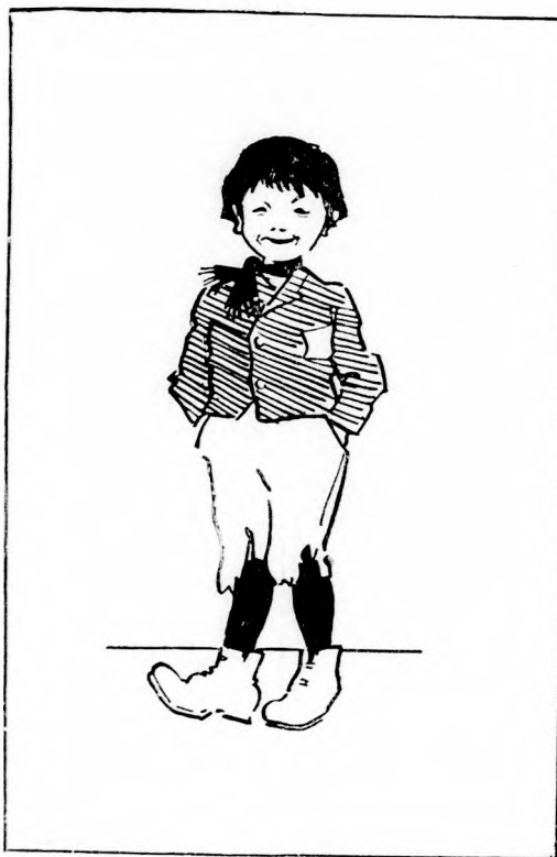
MISIKE. (Lásd a 151. lapon.)

— Ezt a dalt értenünk kellene és mégsem értem. Ó, ó! Hogy nem elég a bölcsességünk!