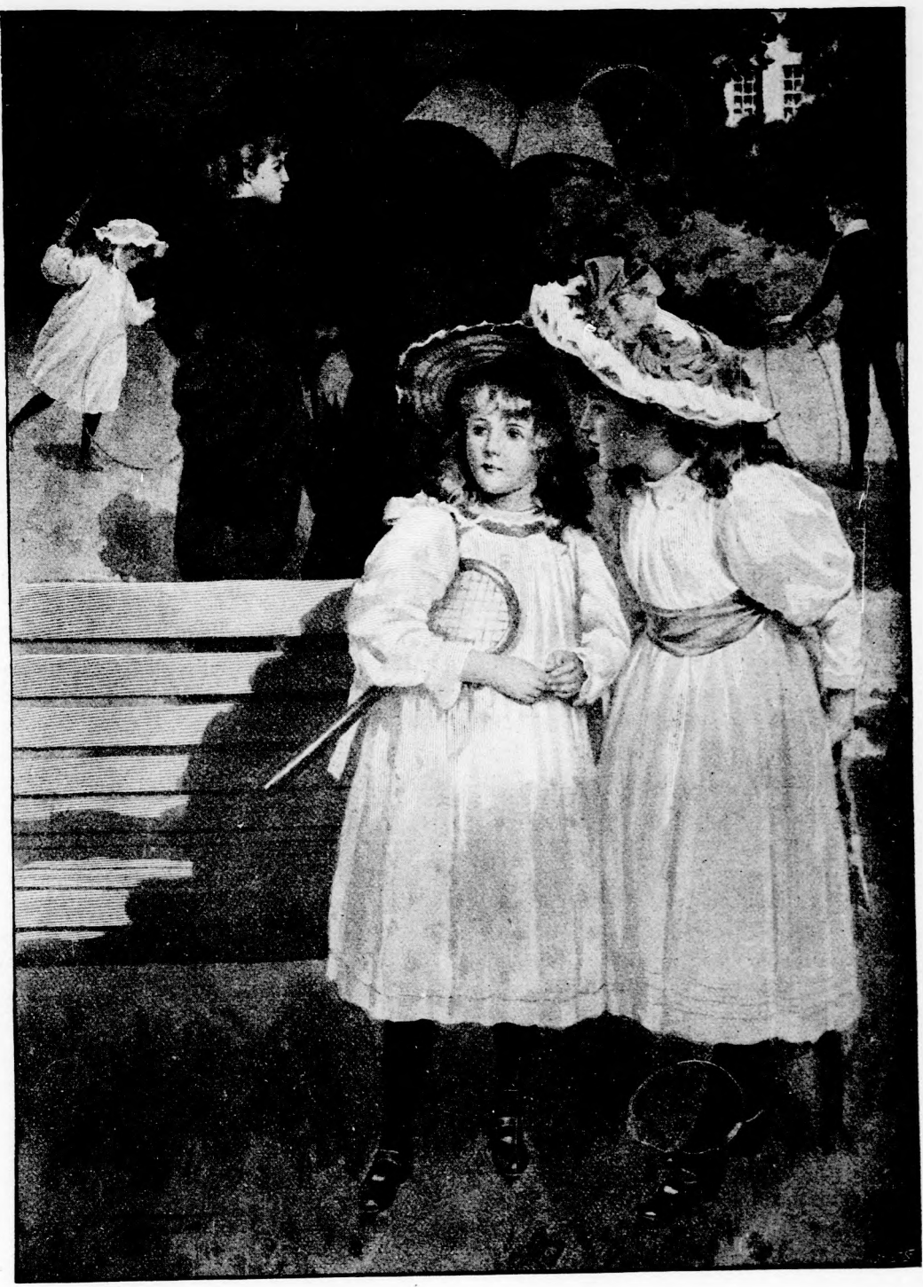
— HALLOTTAD, ARANKA? (Lásd a 260. lapon.)