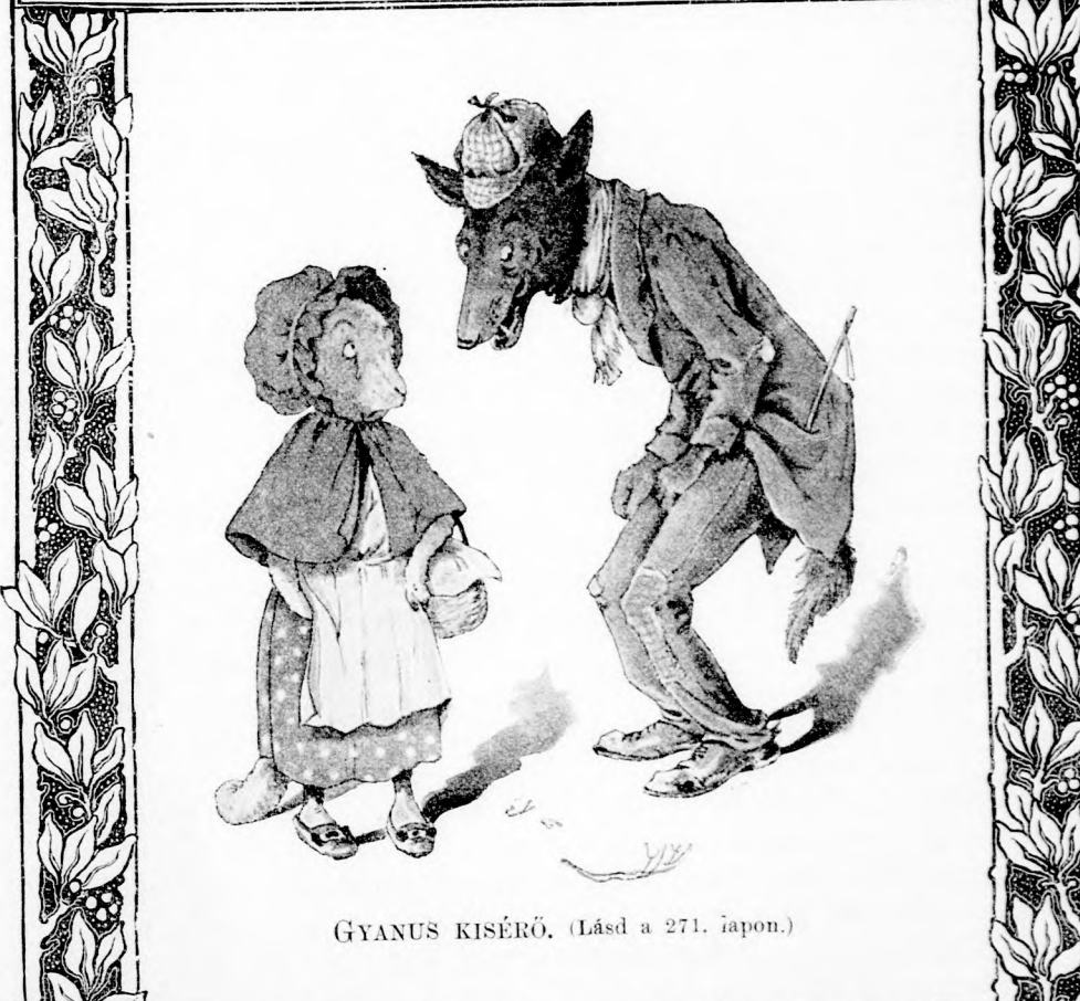
GYANUS KISÉRŐ. (Lásd a 271. lapon.)