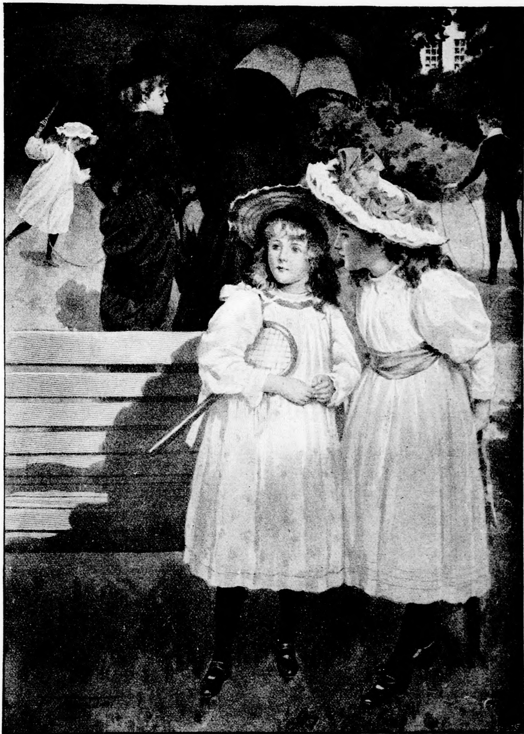
— HALLOTTAD, ARANKA? (Lásd a 260. lapon.)