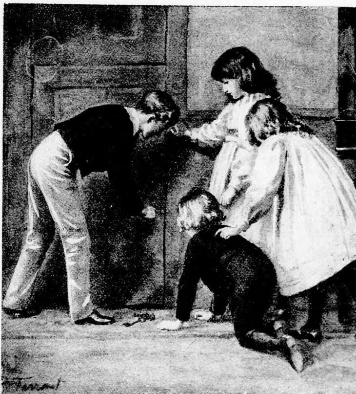
IZGATOTTAN LESTÉK. (Lásd a 309. lapon.)