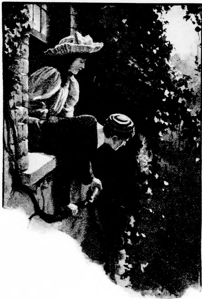
MESSZIRE KIHAJOLT. (Lásd a 308. lapon)

— Fordul, de nagyon nehezen, felett Kálmán. A zár bizonyosan rozsdás. Egy kis olaj kellene.