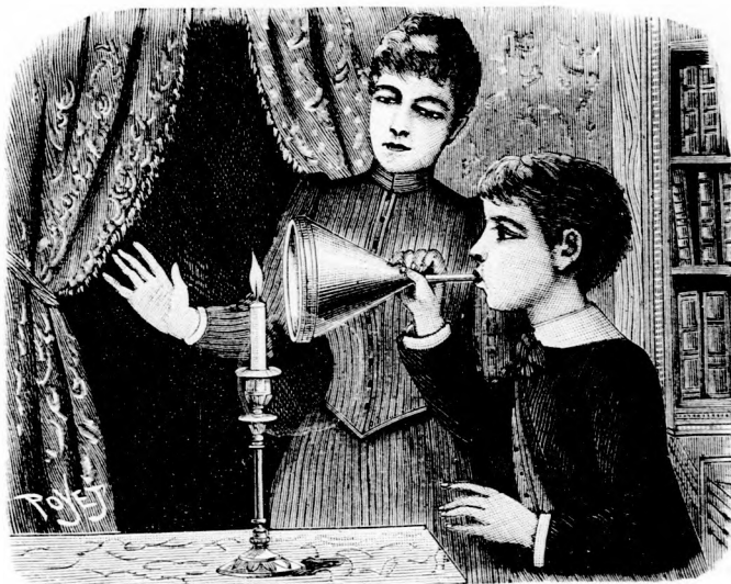
BÜVÉSZET. I. Tölcsér és gyertyaláng. (Lásd a 310. lapon.)

mondta, ne mozduljunk a kosárból, amíg ő meg nem jön az egerészérsől.