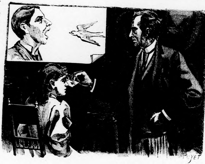
BÜVÉSZET. Az elnyelt madár. (Lásd a 6. lapon.)