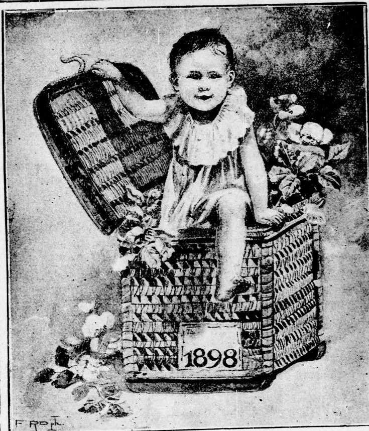
AZ ÚJ-ÉV. (Lásd a 2. lapon.)

103, 231, 367, 414 95, 223, 351, 414 111, 240, 368, 415 128 208, 415 399 176