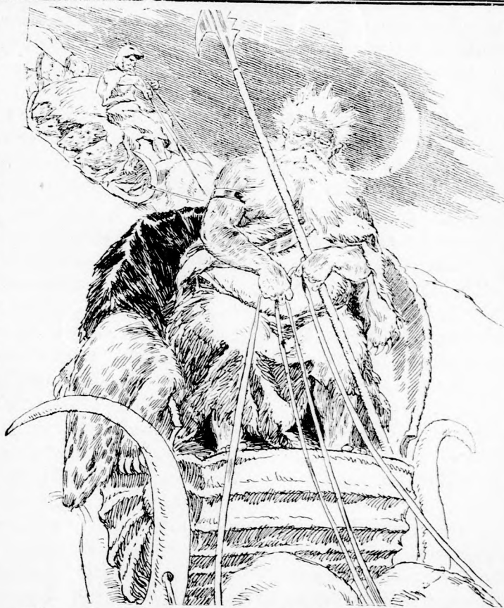
TÉL APÓ . . . SZÁNKÓN HAJTAT ELŐ. (Lásd a 44. lapon)