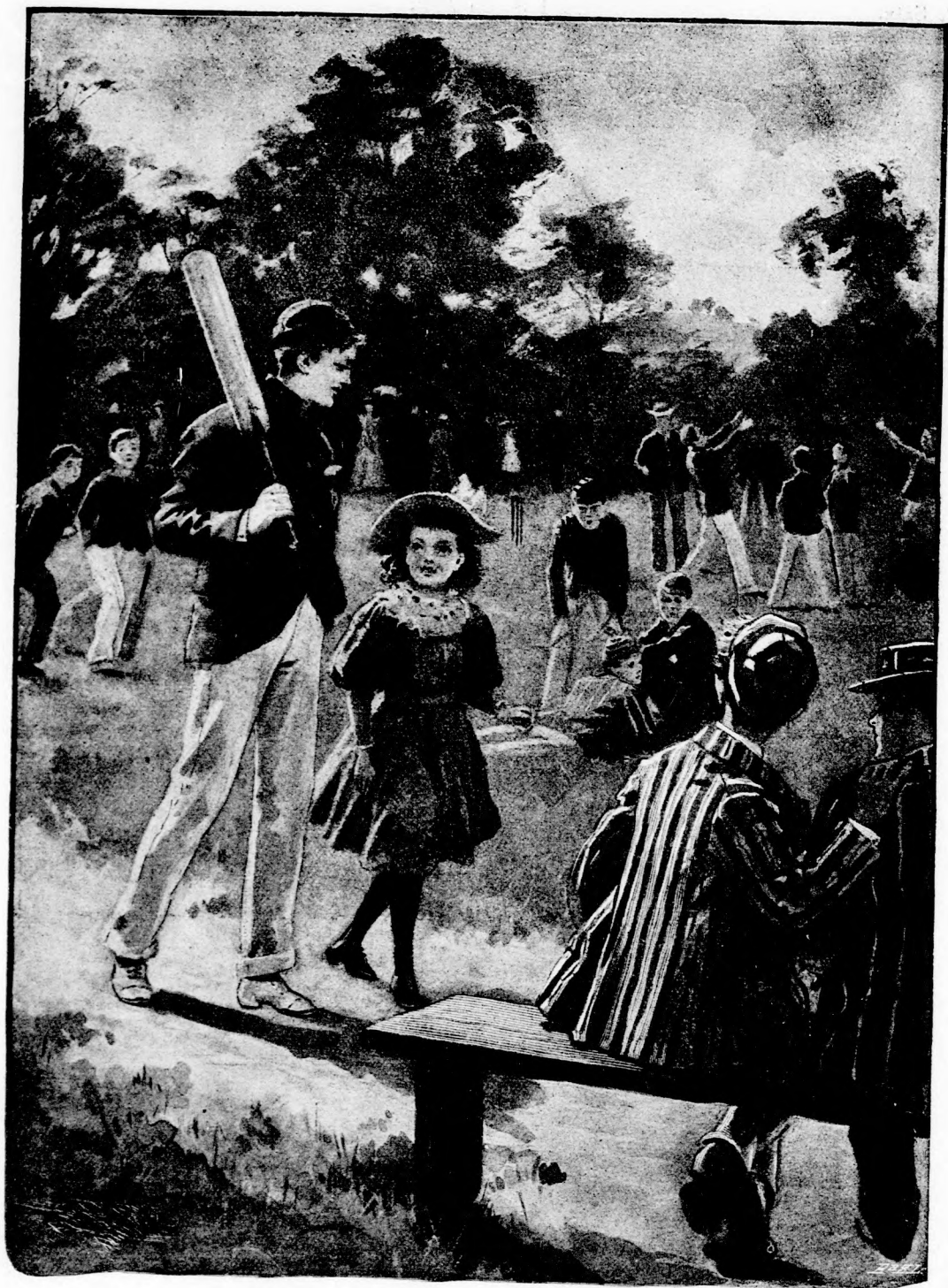
... MEGINDULT A LEÁNYKÁVAL. (Lásd a 38. lapon.)