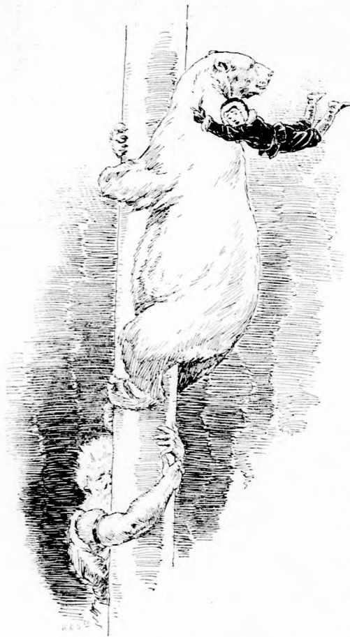
... SEBESEN CSUSSZANTAK LE.

— No, kedves Tél apó, ne vedd zokon, de akkor már mégis csak jobb nálunk,