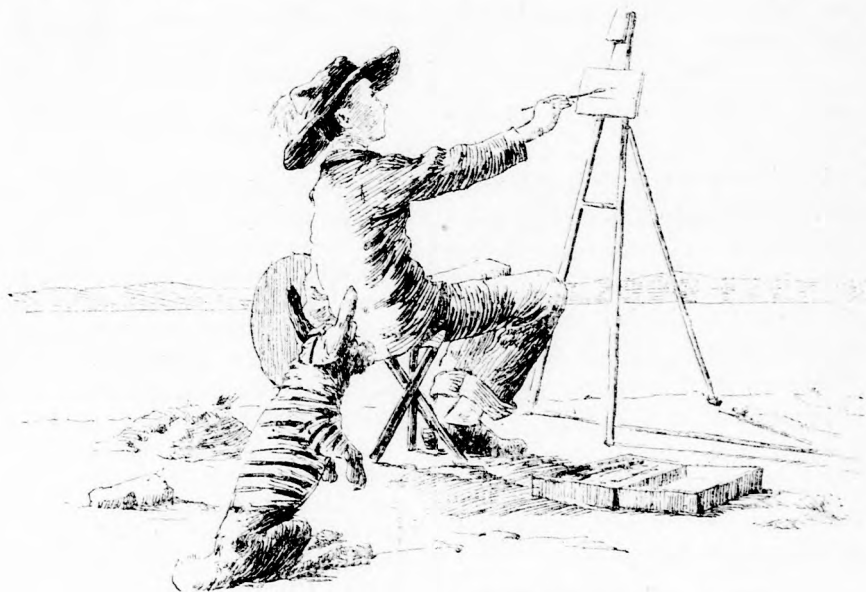
... EGÉSZ KÖZEL JUTOTT HOZZÁ. (Lásd a 139. lapon)

Reggeli nyolcz óra felé dördült el az első lövés. A nyul-család félénken szorult össze, folyton kutatva a könyvekben s remegve, imádkozva a nyulak istenéhez. Nyulapó kénytelen volt könyveire támaszkodni, hogy össze ne roskadjon. A lövések mind