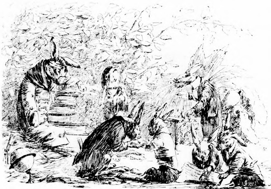
... KÖNYVEKBŐL SZEREZTÉK A BÖLCSESGÜKET. (Lásd a 138. lapon.)

számainkat — te pedig, semmire kellő, ilyen ostoba játékot üzöl? Már évek óta számítgatjuk milyen vastagnak kéne lennie az irhánknek, hogy a serét át ne járja — te pedig évek óta csak garázdálkodol és csavarogsz! De most már csordultig van a pohár! Mehetsz! Mi ugyan többé nem