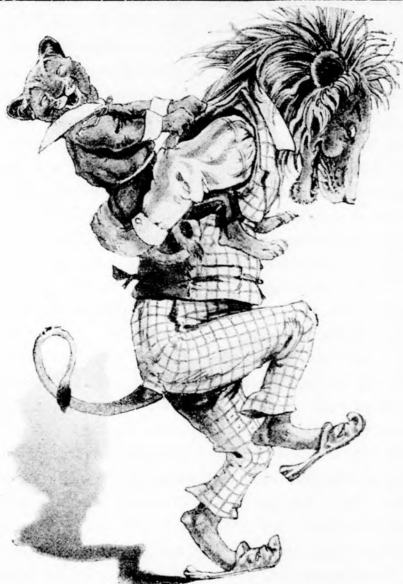
A KIS ZSARNOK. (Lásd a 134. lapon.)