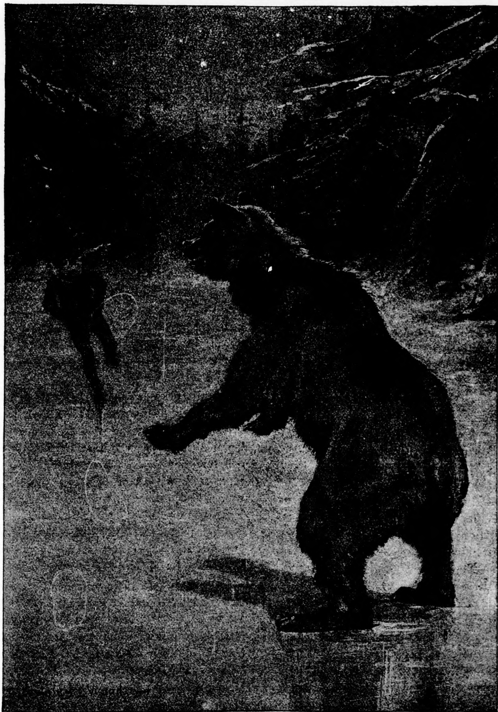
. . . A MACZKÓ . . . FÖLÁLLT. (Lásd a 183. lapon.)