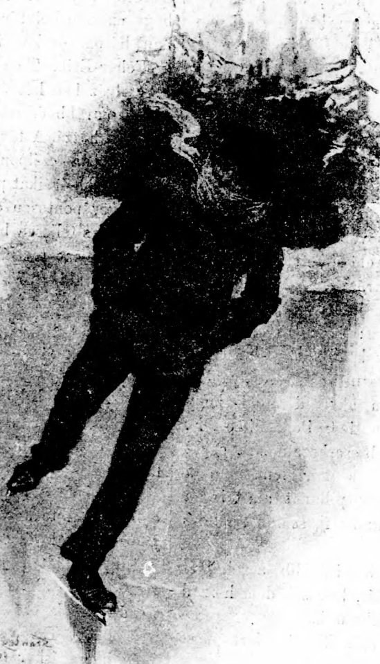
VÉGIG A BEFAGYOTT FOLYÓN. (Lásd a 178. lapon.)