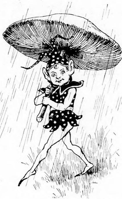
MEGVÉDTE AZ ESŐTŐL. (Lásd a 190. lapon.)