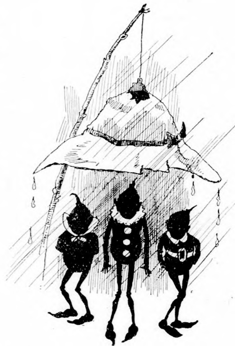
. . . ALÁJA ÁLLTAK. (Lásd a 190. lapon.)

szólt Emi minden kr apától, na És ha má ugy-e man Paprika J