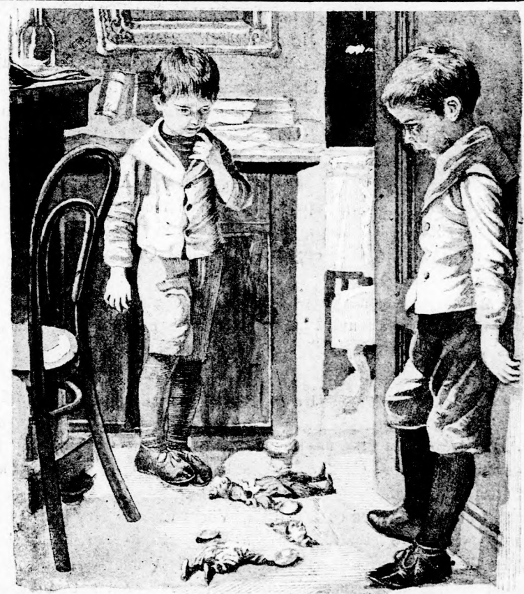
A KÉT PAPRIKA JANCSI OTT HEVERT. (Lásd a 188. lapon.)