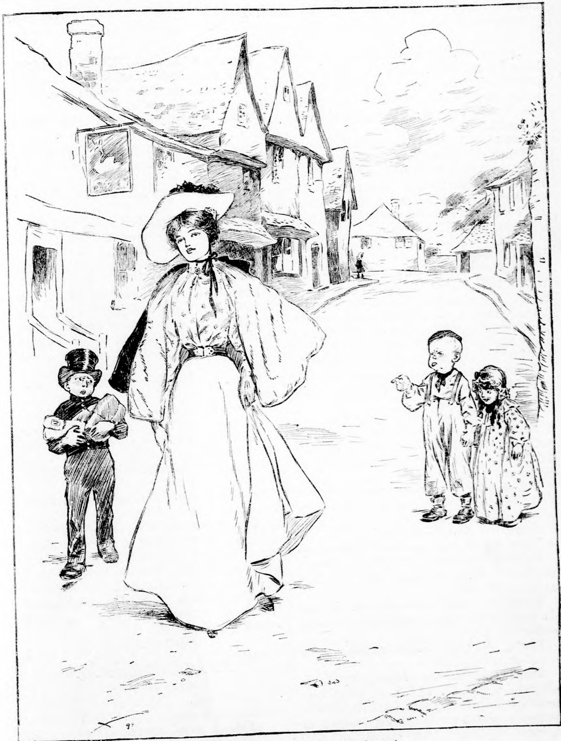
NAGY MÓD BAJA. (Lásd a 198. lapon.)