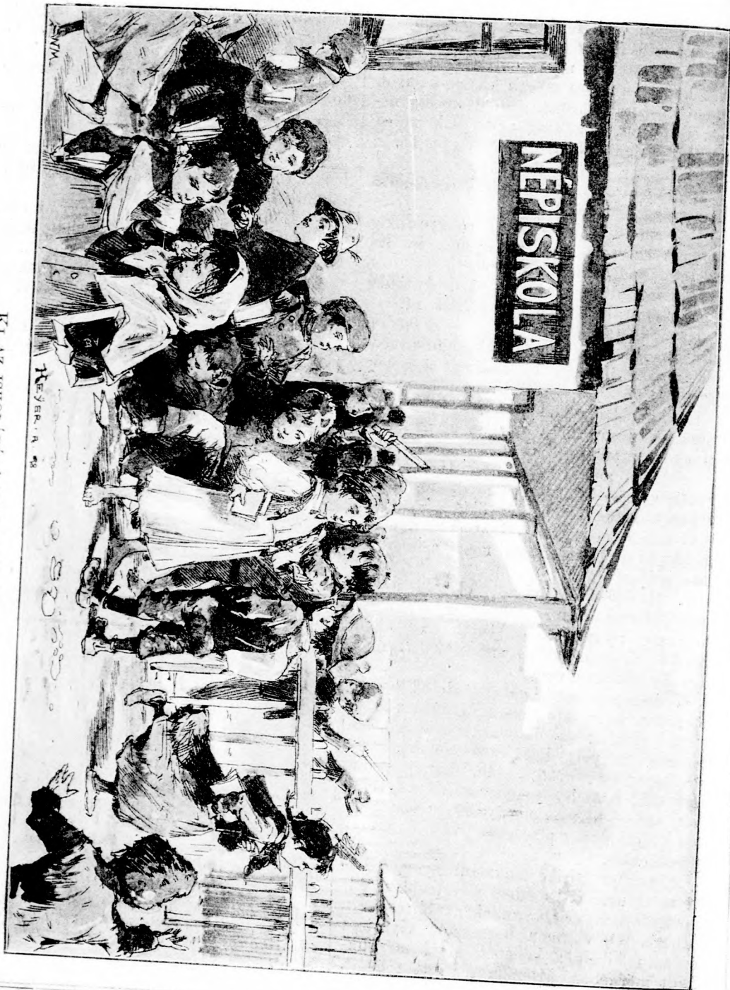
KI AZ ISKOLÁBÓL! (Lásd a 206. lapon.)