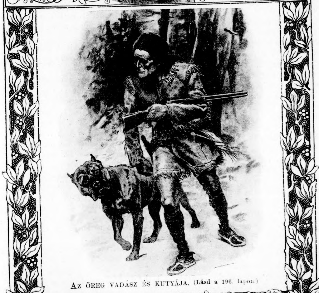
AZ ÖREG VADÁSZ ÉS KUTYÁJA. (Lásd a 196. lapon.)