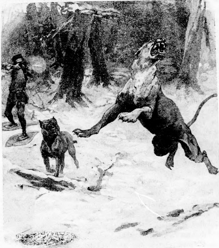
... BŐDÜLÉSSSEL MAGASRA SZÖKKENT. (Lásd a 211. lapon.)