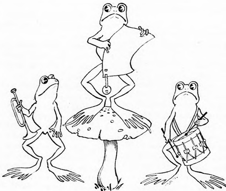
FONTOS HIRDETÉS. (Lásd a 214. lapon.)

minden nap ilyen veszedelmes fenevadba. Aztán meg ha én és Bob korcsolyával a lábunkon ott röpülünk a jégen, jöhet akkor utánunk akár egész tuzat párducz is.