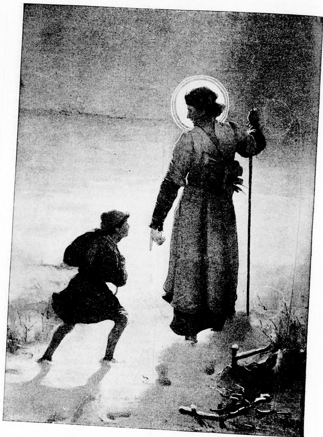
NEHÉZ UTON. (Lásd a 215. lapon.)