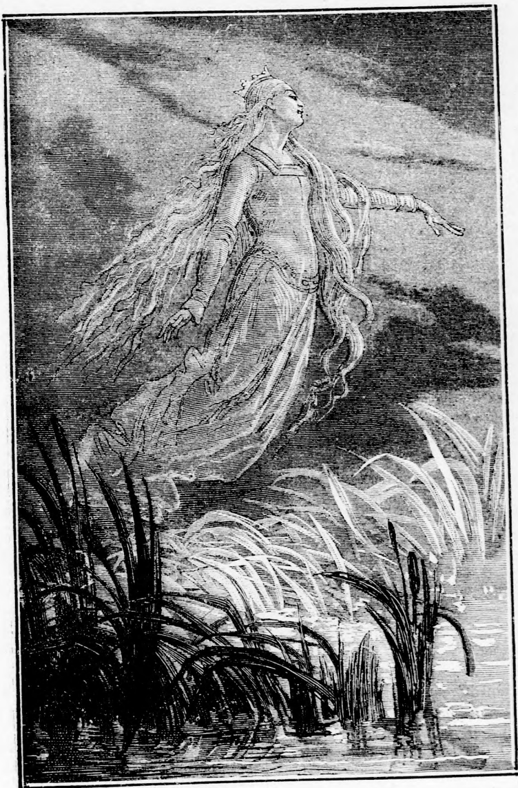
KIKELETKOR. (Lásd a 215. lapon)

Bubuli. — Félek, hiba van a kréta körül . . .