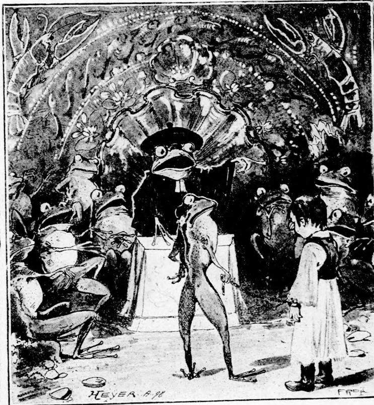
... BÉKA BÖRTÖN-ÖR LÁNCZON TARTJA. (Lásd a 362. lapon.)