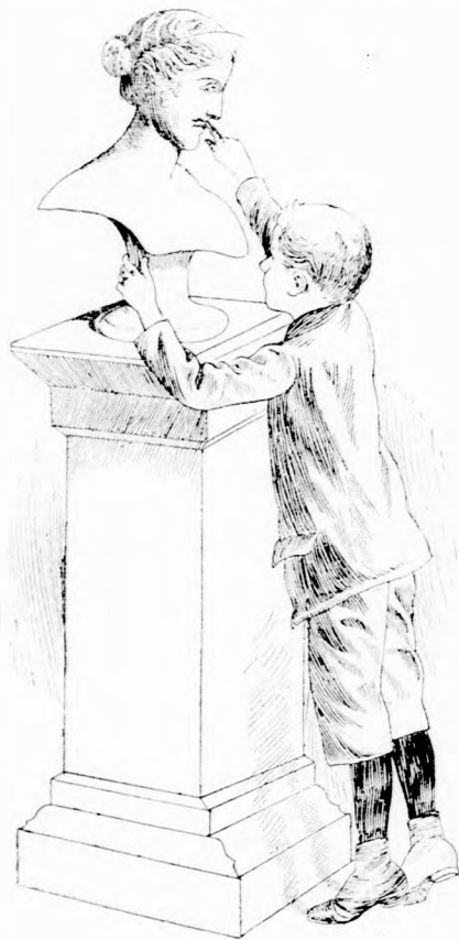
... NEM BIRTA JÓL ELÉRNI.

A szobor talpzata magas volt egy kicsit, Ferke nem bírta jól elérni. Hát amint ott ágaskodik-kapaszkodik, a szobor megindul és a szép isten-asszony lezuhan egye-