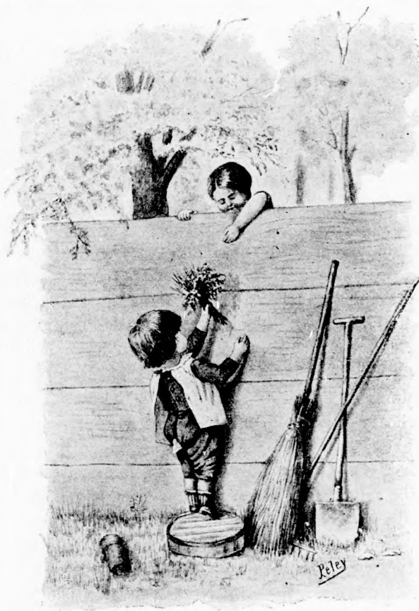
KIS GAVALLÉR, NAGY PALÁNK. (Lásd az 55. lapon.)