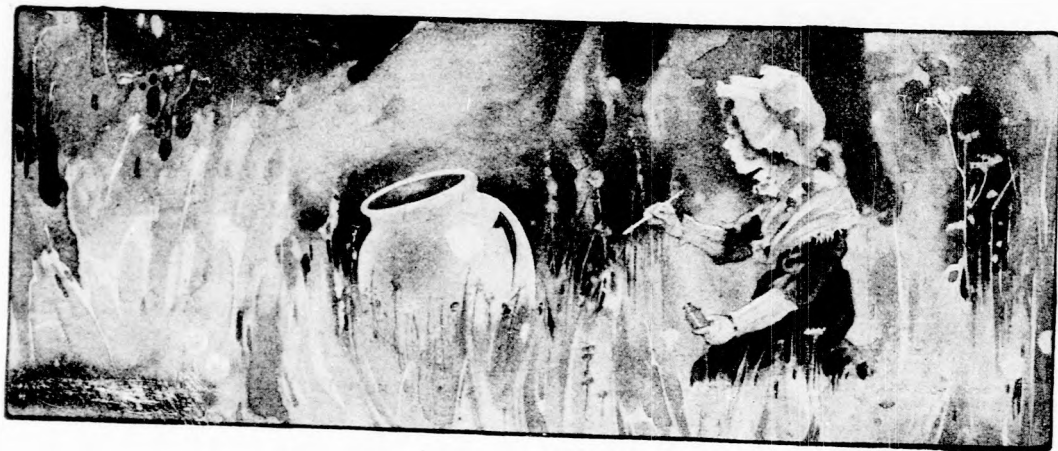
... KEZÉBEN AZ ENYVES ÜVEGCSÉVEL. (Lásd a 86. lapon.)

— Nem kicsit, hanem nagyot, nagyon nagyot! Meg is hálálnám azonnal, csak tudnám, mivel? Kincsem, pénzem nincs, de ha valamiben segítségedre lehetek, szí- vesen megteszem. Szólj, van-e valami kíván- ságod?