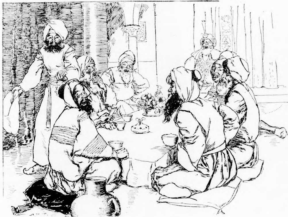
... JÓ KEDVVVEL FOLYT A LAKOMA. (Lásd a 94. lapon)

— Micsoda! És vállalkoztál rá, hogy a kalifa szakácsa leszel! Boldogtalan em-