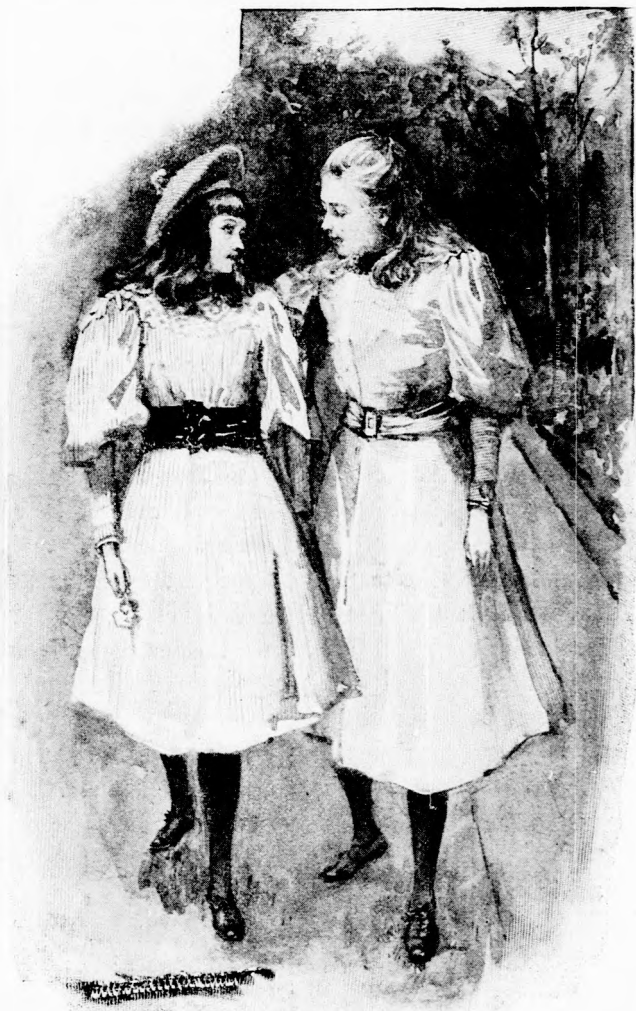
. . . KISÉTÁLTAK A KERTBE. (Lásd a 102. lapon.)

utaztatok? Nem esett semmi bajotok? Nem hagytatok valamit a kocsiban?