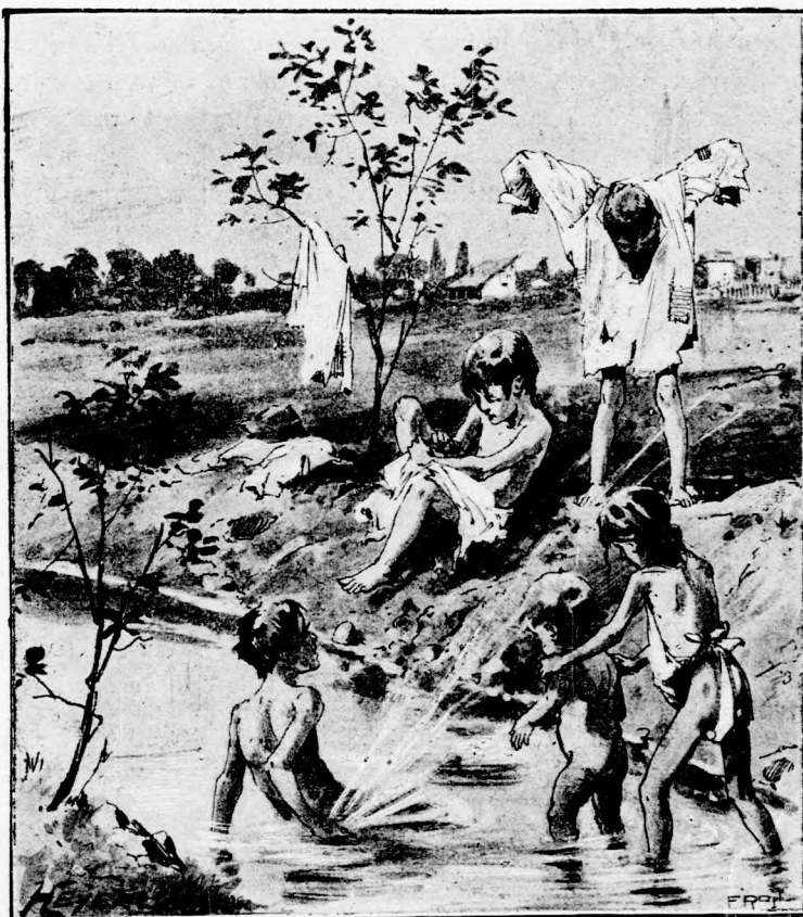
A PATAKBAN. (Lásd a 103. lapon.)