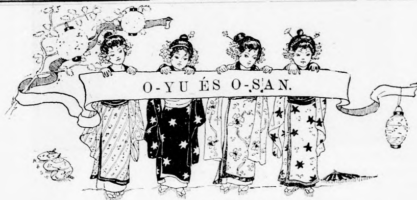
(Képpel a 108. lapon.)

Hát biz ebben csalódtak. Mert Pali kilábolt, azóta sem szegte a nyakát és a híres Rontó Pál lett belőle.