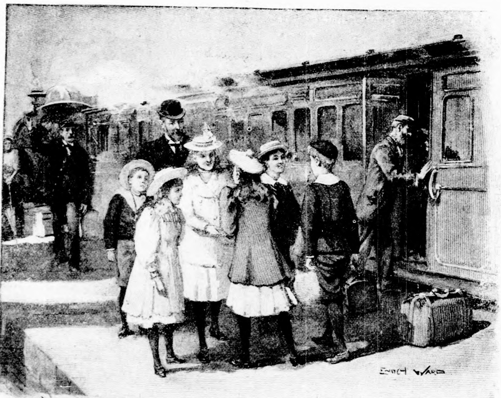
... EGYMÁS KÖZELÉBE ÉRTEK. (Lásd a 98. lapon)

De mialatt ezt mondta, nem nézett atyjának a szemébe, hanem oldalt fordult, mintha valami érdekes dolgot pillantott volna meg. Dezső ezt észre vette és ilyenformát gondolt: