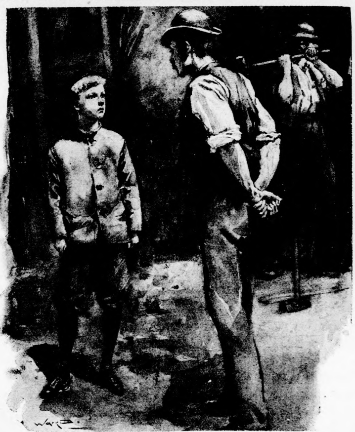
— MIT KERES ITT AZ URFI? (Lásd a 149. lapon.)