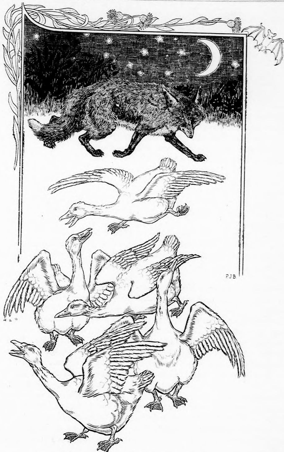
ESZEVESZETTEN FUTOTTAK. . . (Lásd a 151. lapon.)