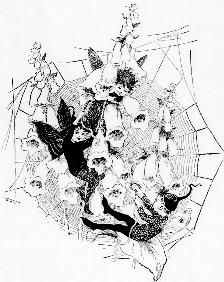
HAJNAL A MEZŐN. (Lásd a 150. lapon.)

— Hát aztán? Annál jobb. Hiszen azt akarom látni, hogyan ássák az aranyat.