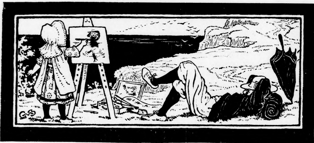
KÉRETLEN SEGÍTSÉG. (Lásd a 159. lapon.)

Végre azonban, nagy sokára, zaj hallatszott messziről: a hajtók lármája. Kerge-