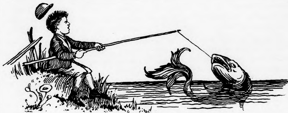
BAJOS HALÁSZAT. (Lásd a 151. lapon.)

Nem egyhamar jött biz' a. Jobbra-balra folyvást hallatszik a puskadurrogás, én pedig tétlenül állok! De végre ismét intett a szerencse: egy fiatal nyul bukkant elő szemközt. Ez nem futott olyan veszettül; alkalmasint tapasztalatlan süldő, még nem érti a veszedelmet. No, ezt biztosan leteritem. Az ilyen süldő ám az igazi jó pecsenye!