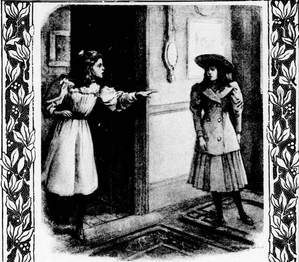
— VALAMI BAJ TÖRTÉNT? SZÓLJ! (Lásd a 196. lapon.)