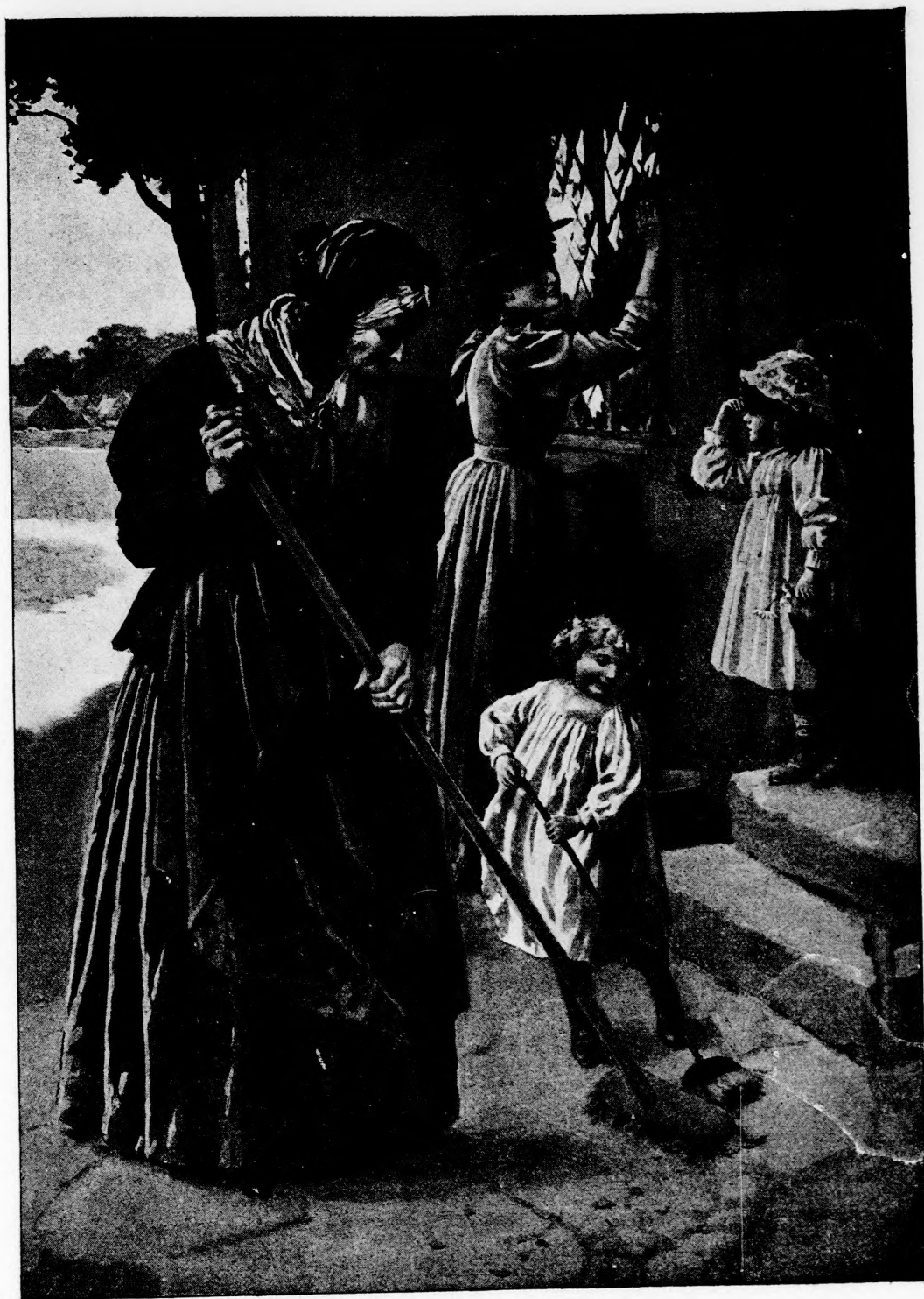
ÜNNEP ELŐTT. (Lásd a 207. lapon.)