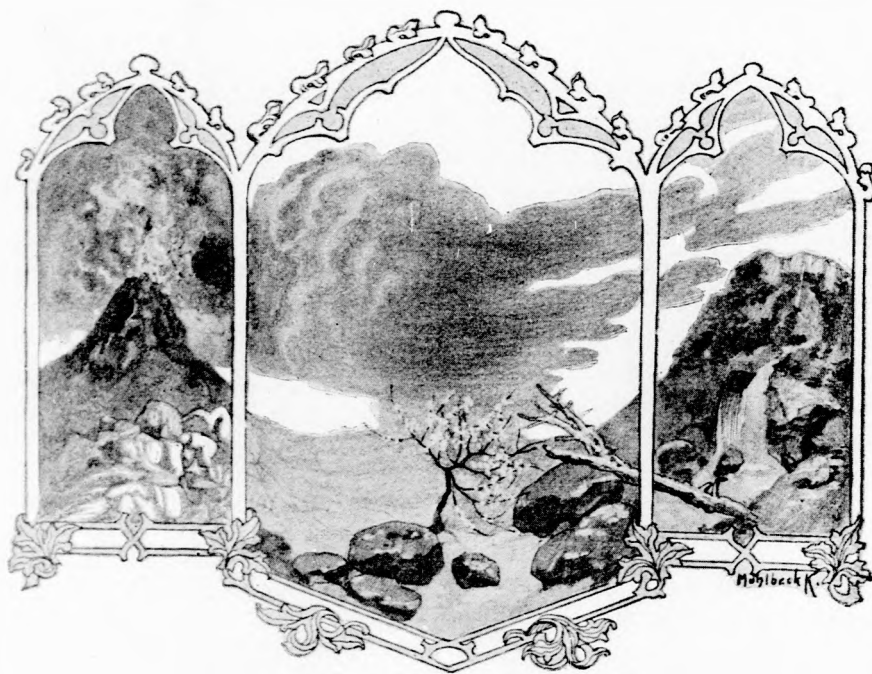
... MAGÁNOSAN ÁLLÓ SZIKLA-KUPOK.

Hajdanában, réges-régen, nem volt itt ez a nagy víz, hanem gyönyörű rónaság terült el a helyén. Hatalmas óriások laktak e tájékon s garázdálkodtak szörnyü-