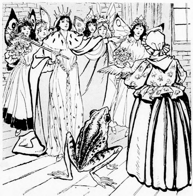
Ó, IRGALMAZZ, JÓ KIRÁLYNŐ! (Lásd a 189. lapon.)