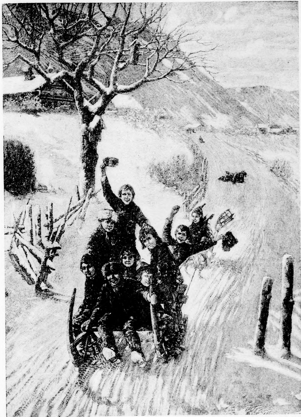
LE A HEGYRŐL! (Lásd az 54. lapon.)