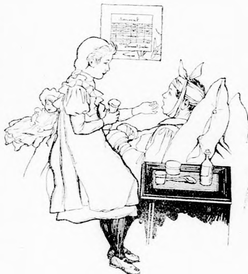
... HORDTA NEKI A CZUKORKÁKAT. (Lásd az 53. lapon.)

— Jaj, minek is jött ide ez az ördög! sopánkodott Mari a szakácsné és vele a többi cseléd, mikor a csata-tért föl kellett surolniok és a bemocskolt ruhákat, butorokat tisztára mosniok. És az a sok tojás! Soha ilyen Roszcsontot! Még azt a kedves Pista ifurat is elcsábította, szegény-