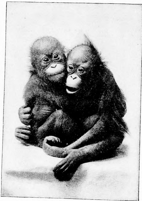
HOSSZU-KEZŰ TESTVÉR-PÁR. (Lásd az 55. lapon.)

jól magát. Ezért aztán, ha Európába kerül, kora ősztől késő tavaszig nagyon gondosan kell óvni; de még így is néhány év alatt rendesen elpusztul.