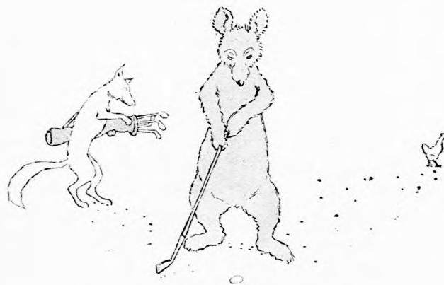
NEKI KÉSZÜLT. . . (Lásd a 189. lapon.)

Igen ám, de ekkor már ott termett Maczkó uram is, aki hallotta a Tyúk néni jajgatását.