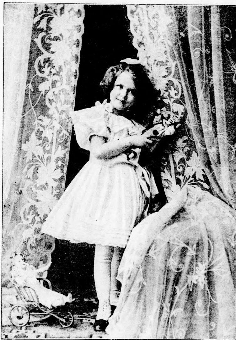
JULISKA BÁLBA MEGY. (Lásd a 183. lapon.)

össze, hogy igazán majdnem uj számba mehetett. Katuska tánczolt, ugrált s nagy örömében össze csókolta jó testvérét.