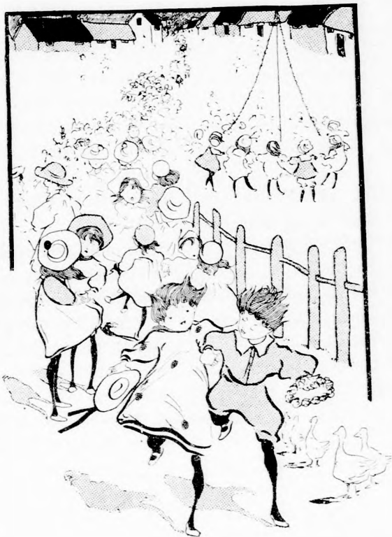
MAJÁLIS HÖSE. (Lásd a 341. lapon.)