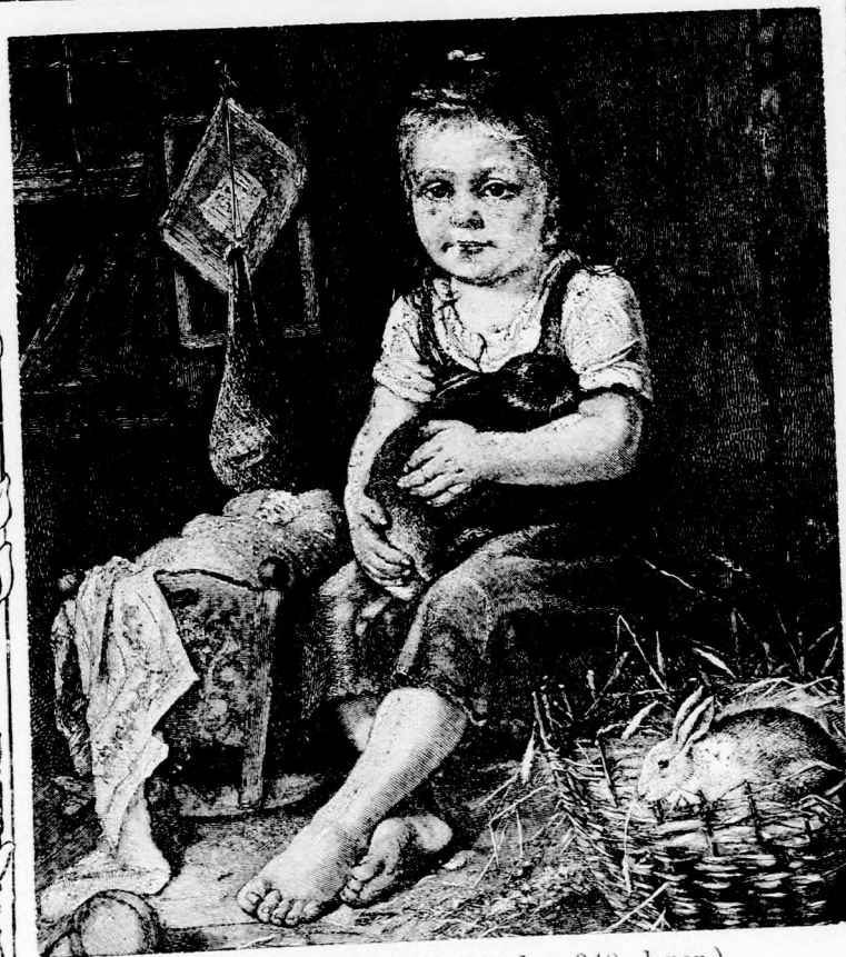
ZAVARTALAN ÖRÖM. (Lásd a 340. lapon.)