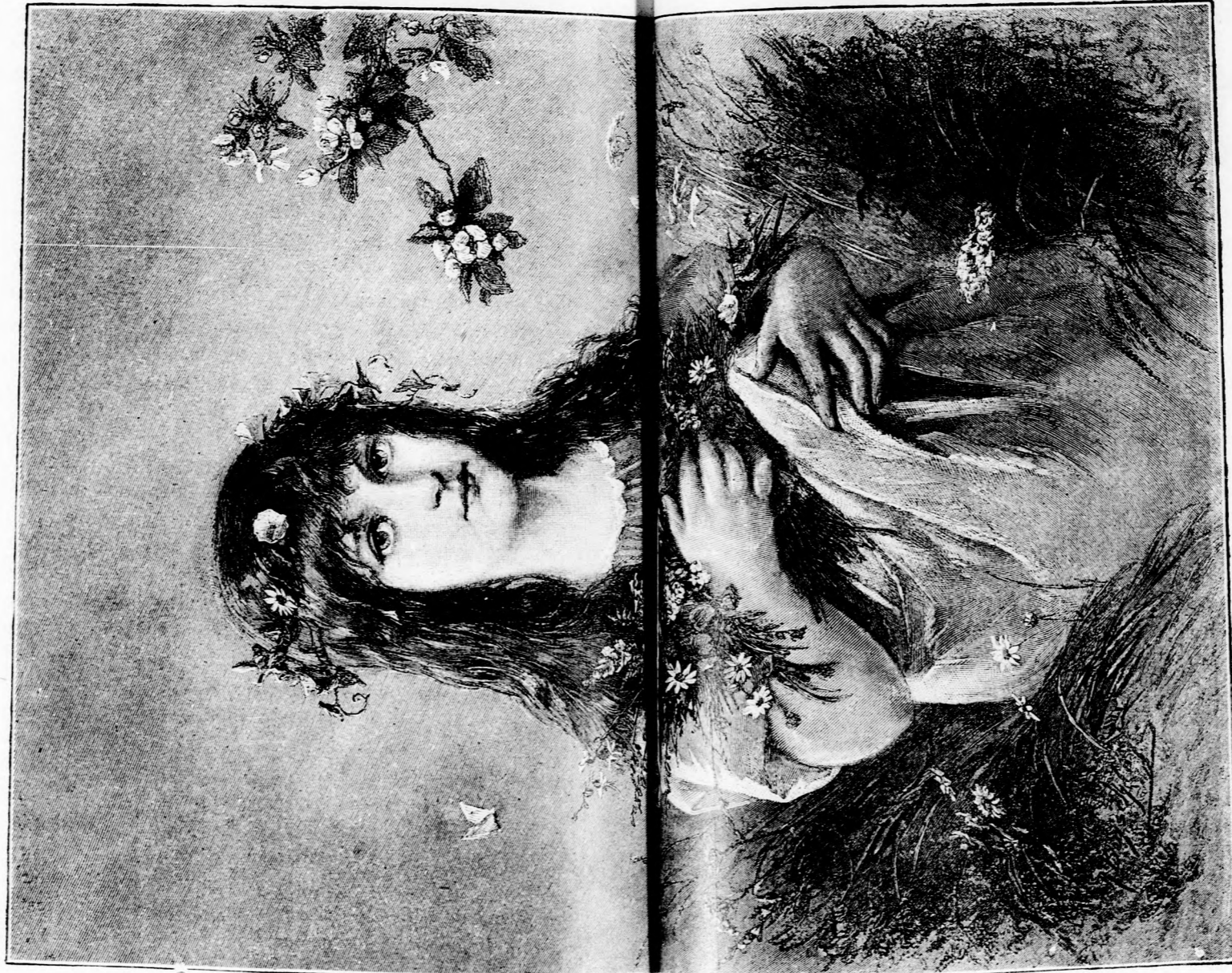
TAVASZI BOLDOGSÁG (Lásd a 340. lapon.)

Ilyképen teljesült a fiunak mind a két kíván-