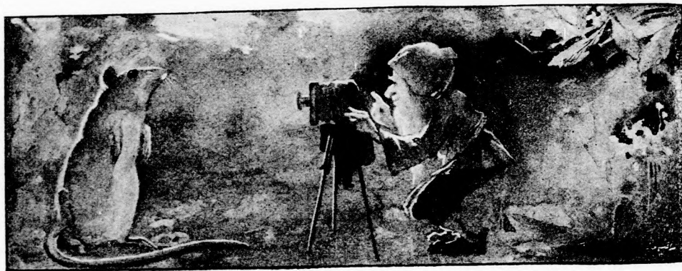
... ÁLLJON KÉT LÁBON ÉS VÁGJON NYÁJAS POFÁT. (Lásd a 346. lapon.)

— Ahogy tetszik. Akkor nem hizlalom tovább a patkányodat, hanem megetetem