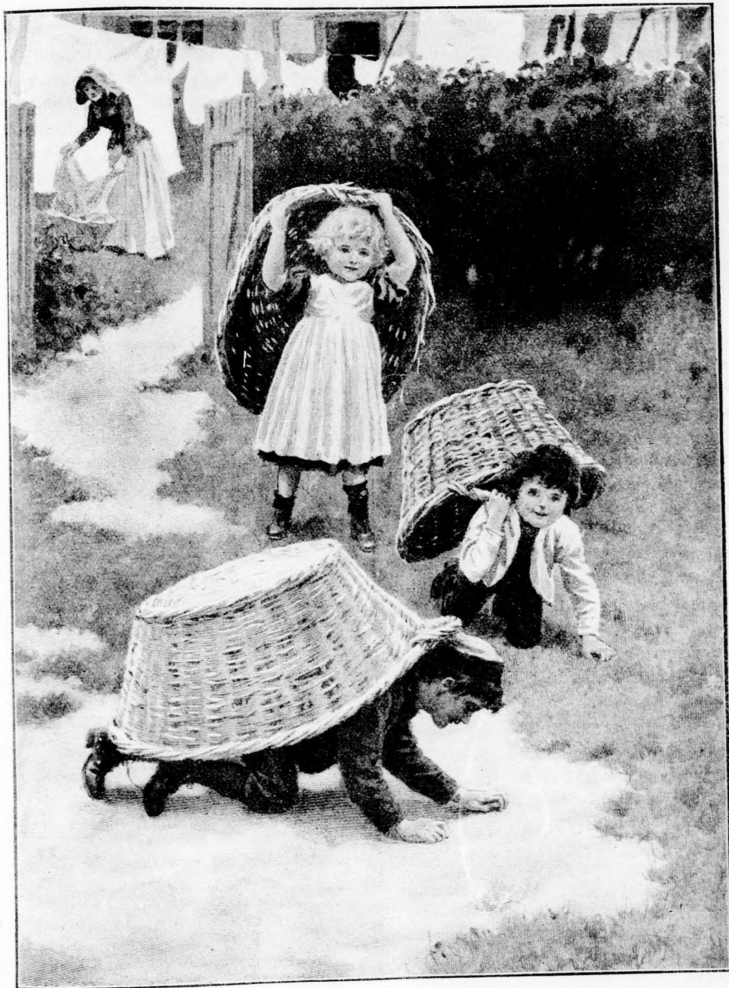
... HÁTUKRA BORITOTTÁK A RUHÁS KOSARAT. (Lásd a 358. lapon.)