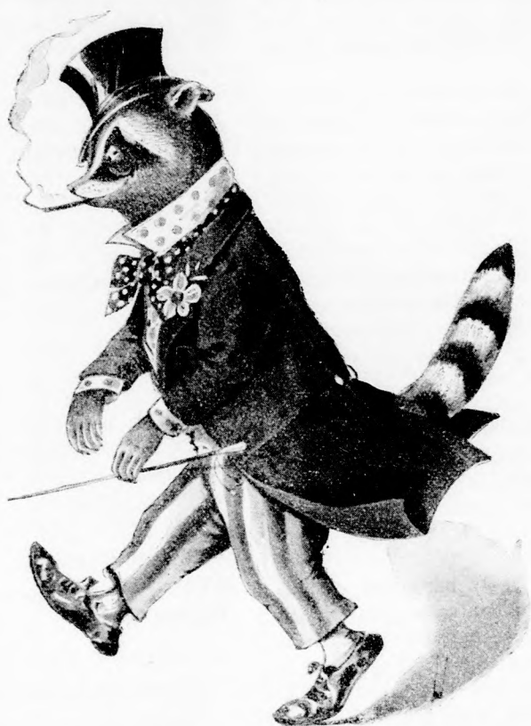
RÓKA URFI SÉTÁJA. (Lásd a 358. lapon.)