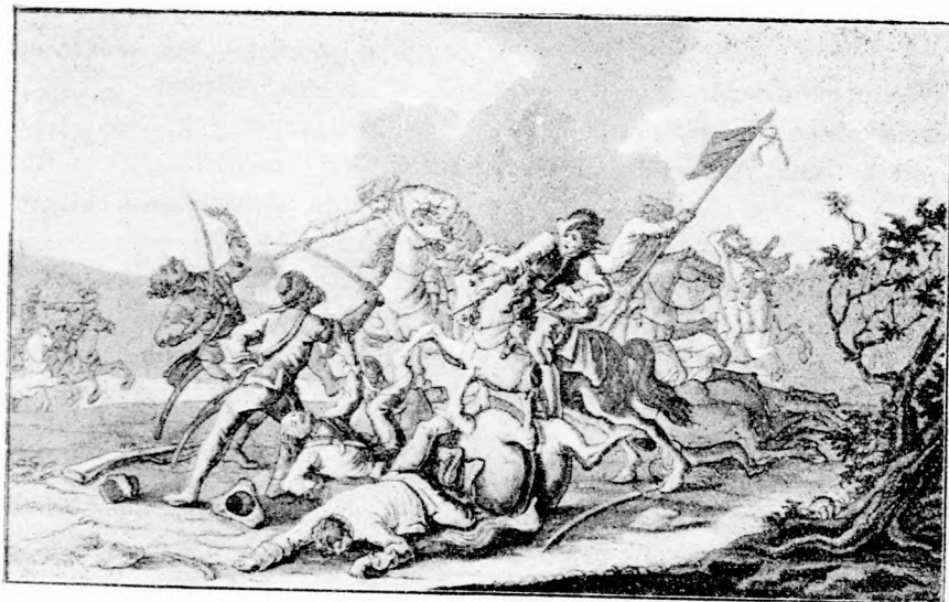
CSATÁZÓ KURUCZOK. Egykoru rajz után. (Lásd a 366. lapon.)

Nagy volt a bécsi udvarnál a német és cseh tanácsosok haragja és ijedelme, hogy a fiatal Rákóczi, akinek ha nem halált, hát legalább is örökös rabságot szántak,