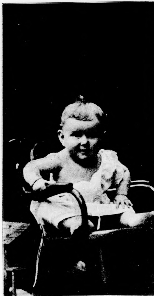
ESZTIKE. (Lásd a 11. lapon.)

— Igen is, felséges királyom, elvállalok én akár milyen nehéz szolgálatot.