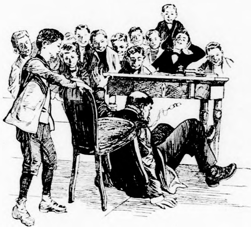
... KIRÁNTOTTA A TANÁR UR ALÓL A SZÉKET.

Nemde egész kincses kamra ez az áldott fa!