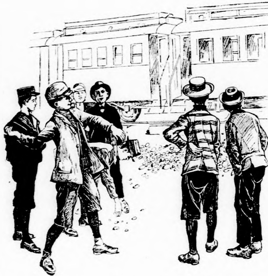
REPÜLT A GYÖNYÖRÜ KAVICS . . .

Persze, megjárta szegény Ferke az ő jóságával. Az iskolában történt, hogy az a semmiházi Vad Laczi, aki haragszik az egyik tanárra, gombostűt szurt a székébe, mert valami kellemes meglepetéssel akart szolgálni a tanár urnak meg az osztálynak. Jött is nagy-méltóságosan Győry Imre uram és semmit sem sejtve, le akar eresz-