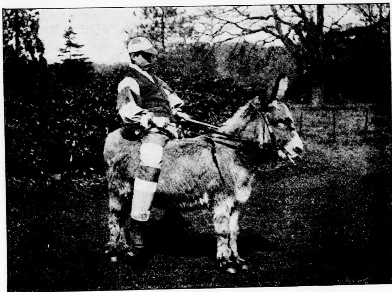
A GYŐZTESEK. (Lásd a 6. lapon.)

Ugy látom, valami különb szolgálatot szeretnél. De nekem éppen csak olyan disznó-pásztorra van szükségem, aki meg tudja őrizni a posikáimat. Még eddig nem akadtam ilyen legényre. Egyik sem hozott estére annyit haza, ahányat reggel kihajtott.