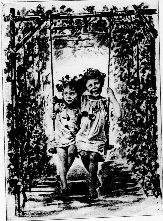
HINTA. (Lásd a 6. lapon.)