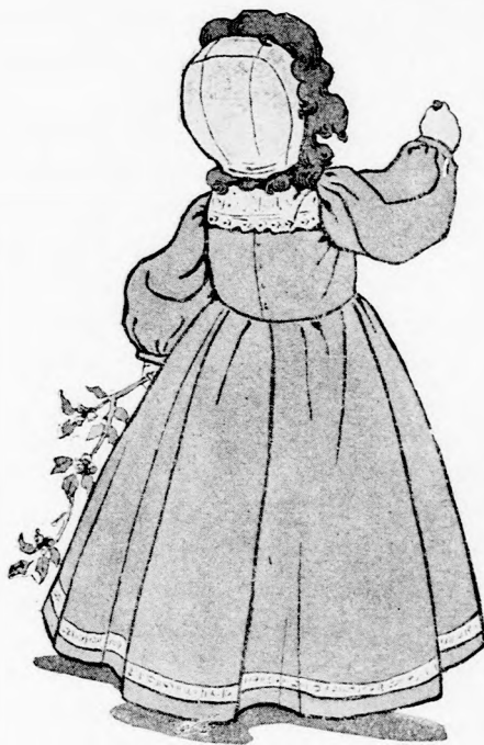
... PIROS BOGYÓS GALYAT TARTOTT A KEZÉBEN. (Lásd a 108. lapon.)