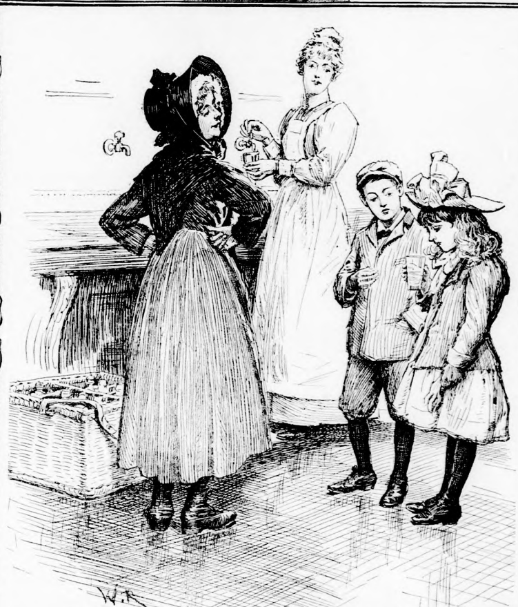
KORTYINTOTT A VIZBŐL. (Lásd a 100. lapon.)