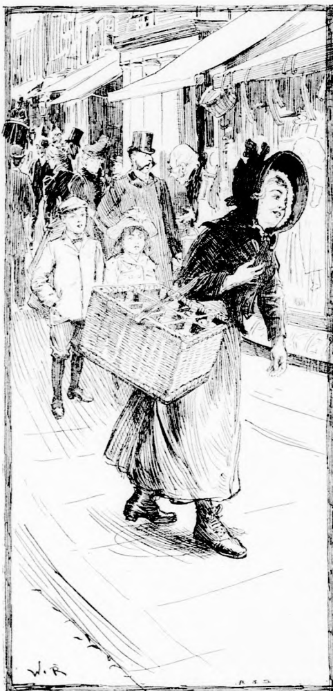
... NYOMON KÖVETTÉK. (Lásd a 98. lapon.)