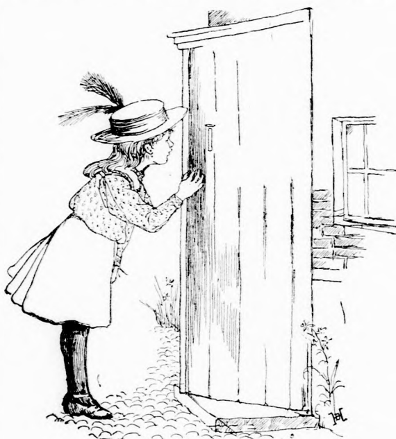
BEKUKUCKÁLT A KULCS-LYUKON.

Diadalmas képpel osont el az ajtótul. Megtudta a titkot, melyet a fiúk annyira rejtegettek. Kifogott rajtuk, most majd ő bosszantja meg őket. Persze, nem szabad magát elárulnia, hogy megleste őket; de úgy félig-meddig értésökre adja, hogy mindent tud. De jó tréfa lesz!