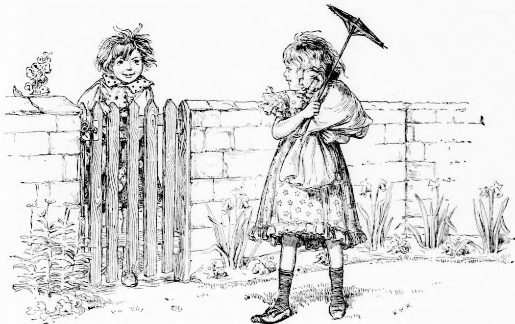
A ROSSZ SZOMSZÉD. (Lásd a 102. lapon)

— Jösz onnan tüstént? kiáltott. Nem szabad ott járnunk... reggel is elkergettek onnan!