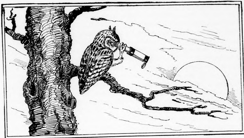
A BAGOLY ÉS A NAP. (Lásd a 122. lapon.)

— Erősen összekötözzük gólya komának a csőrét, hogy ki se tudja nyitni.