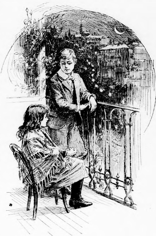
... KIÜLTEK AZ ERKÉLYRE. (Lásd a 118. lapon.)