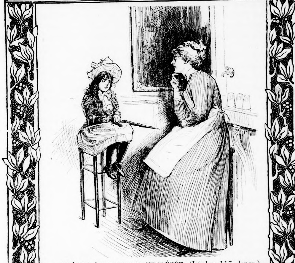
...SZÉKRE ÜLTETTE KIS VENDÉGÉT. (Lásd a 117. lapon.)