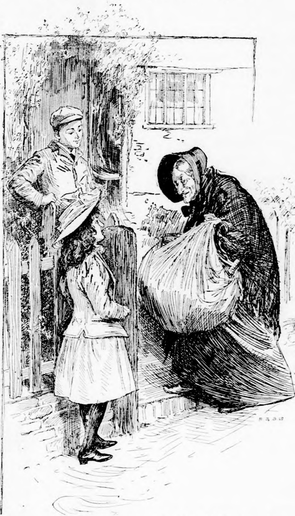
... RÁJOK ISMERT. (Lásd a 147. lapon.)

— De éppen téged kerestek, tubiczám, szólt az anyóka.