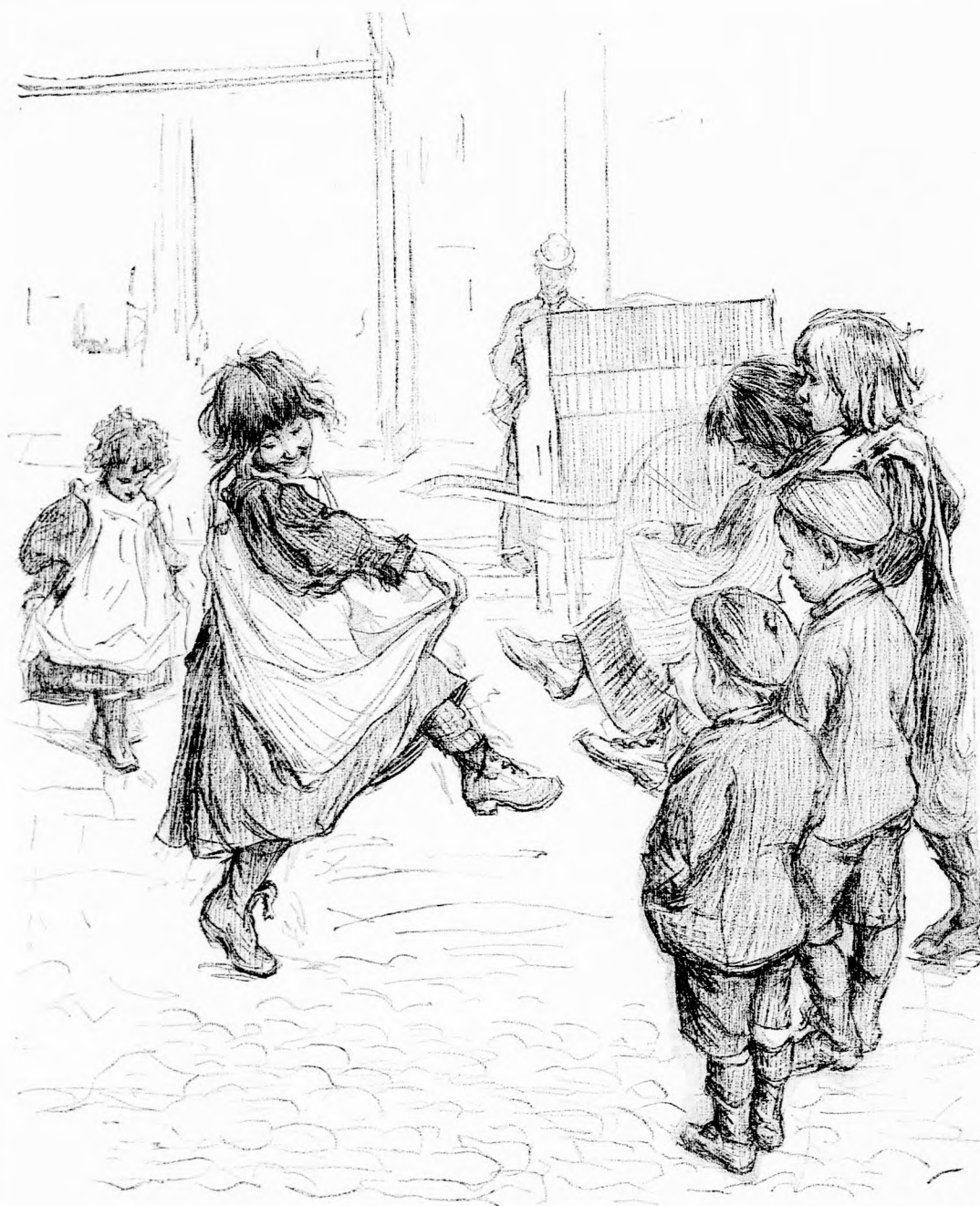
UDVARI BÁL. (Lásd a 155. lapon)