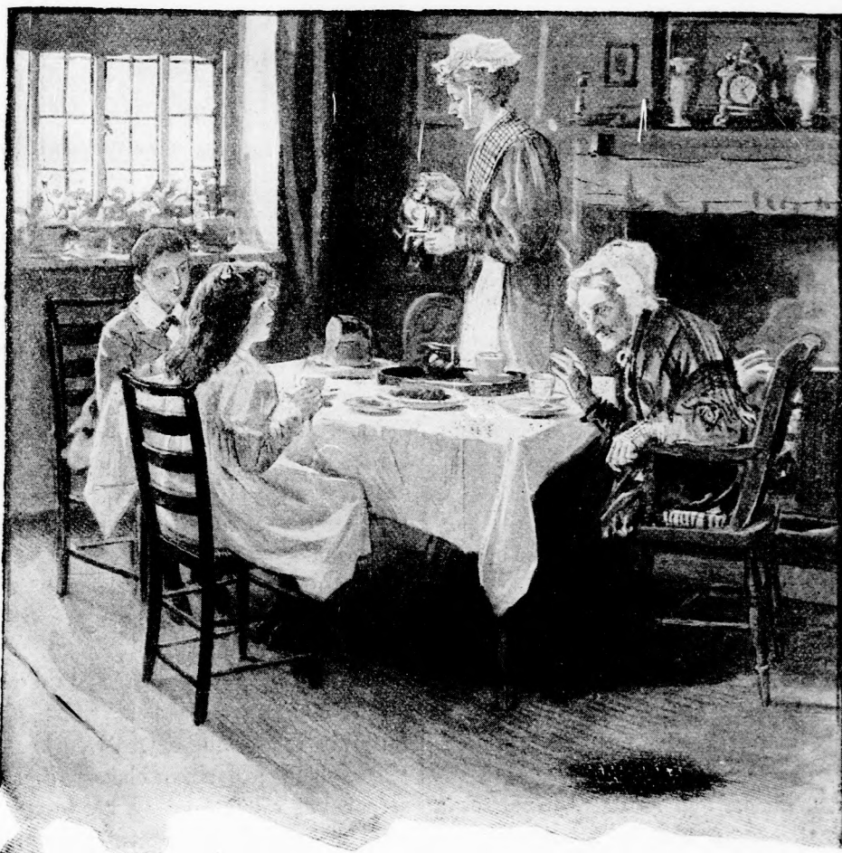
VIDÁMAN OZSONNÁZGATTAK. (Lásd a 149. lapon.)