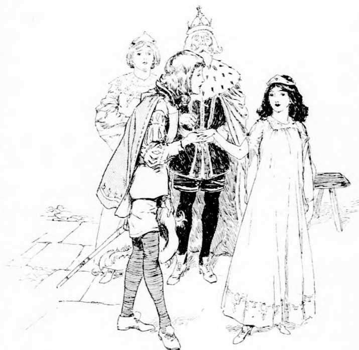
FELESÉGÜL VISZEM HAZA. (Lásd a 263. lapon.)