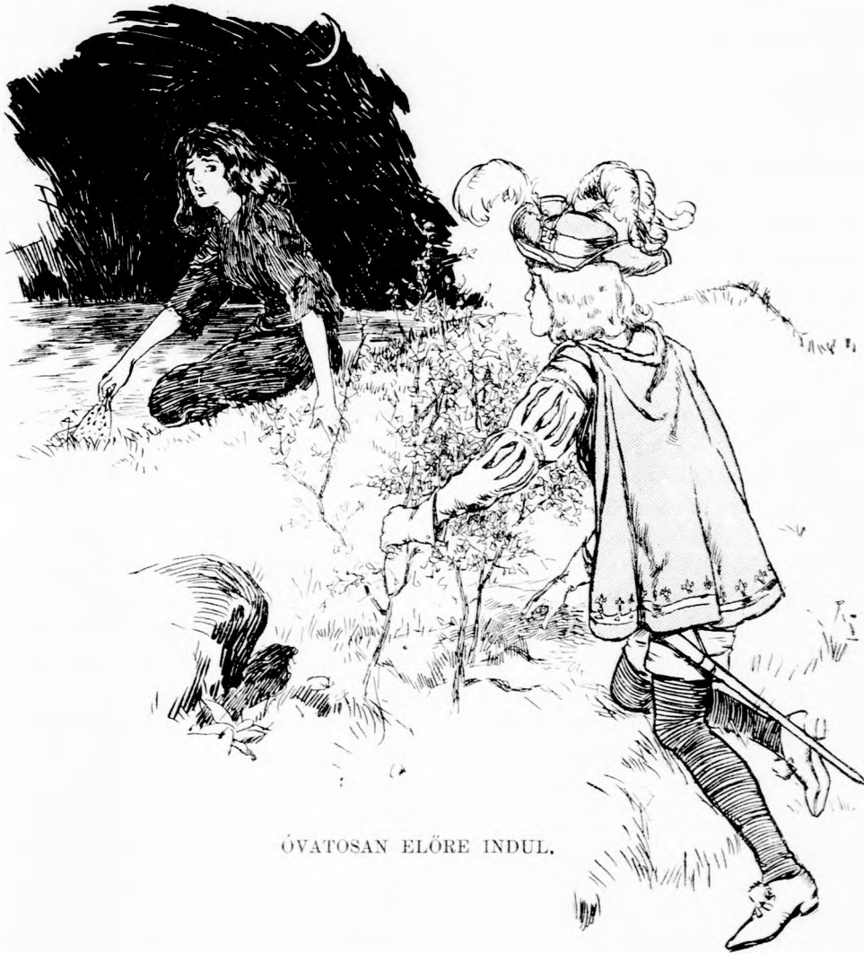
ÓVATOSAN ELŐRE INDUL.

A királyfi. — Ej, de boszantó! (Arra felé néz, amerre Ibolya távozott.) S mily