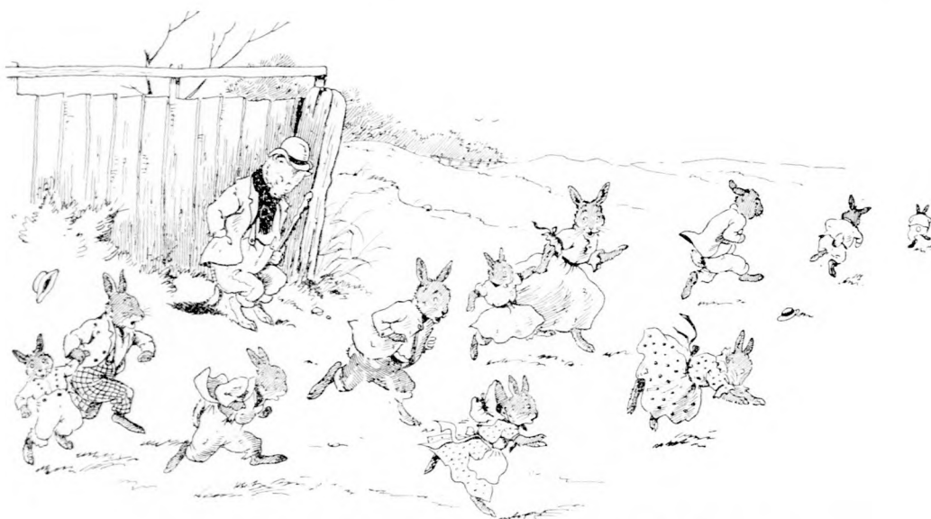
ITT SZÖKÖTT KI AZ EGÉSZ NYUL NÉPSÉG. (Lásd a 335. lapon.)

ur. Megpróbáltam én azt sokszor, de azok a gézengúz Tapsiék úgy építették a tanyájokat, hogy minden oldalon van kijáratuk, nem is egy, hanem tíz is. Akár merről támadunk rájuk, elmenekülnek a másik oldalon. Okosabbat gondolhattál volna ki.