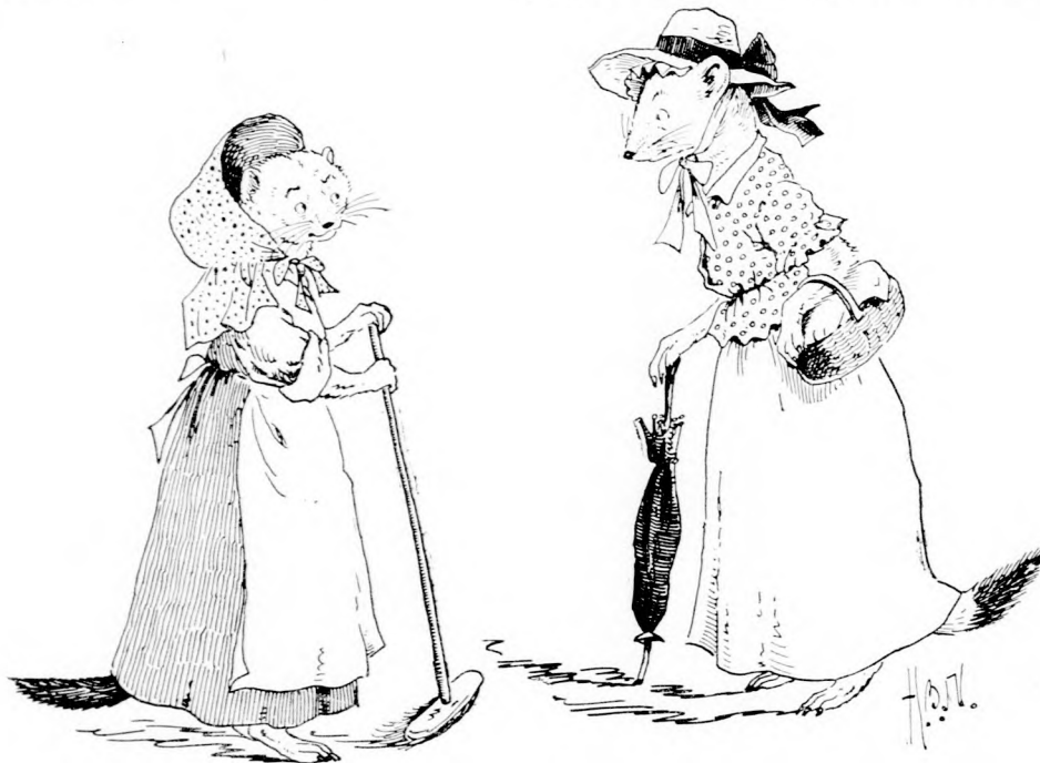
... ELPANASZKODOTT KOMA-ASSZONYÁNAK. (Lásd a 331. lapon.)

Hiven megtartotta tehát a nyulacsját, fogadott barátságot és ha kísértelt a környékre, mindig ott settenkedett, ahol Nyuszikával, az ő jószívű szó-szólójával