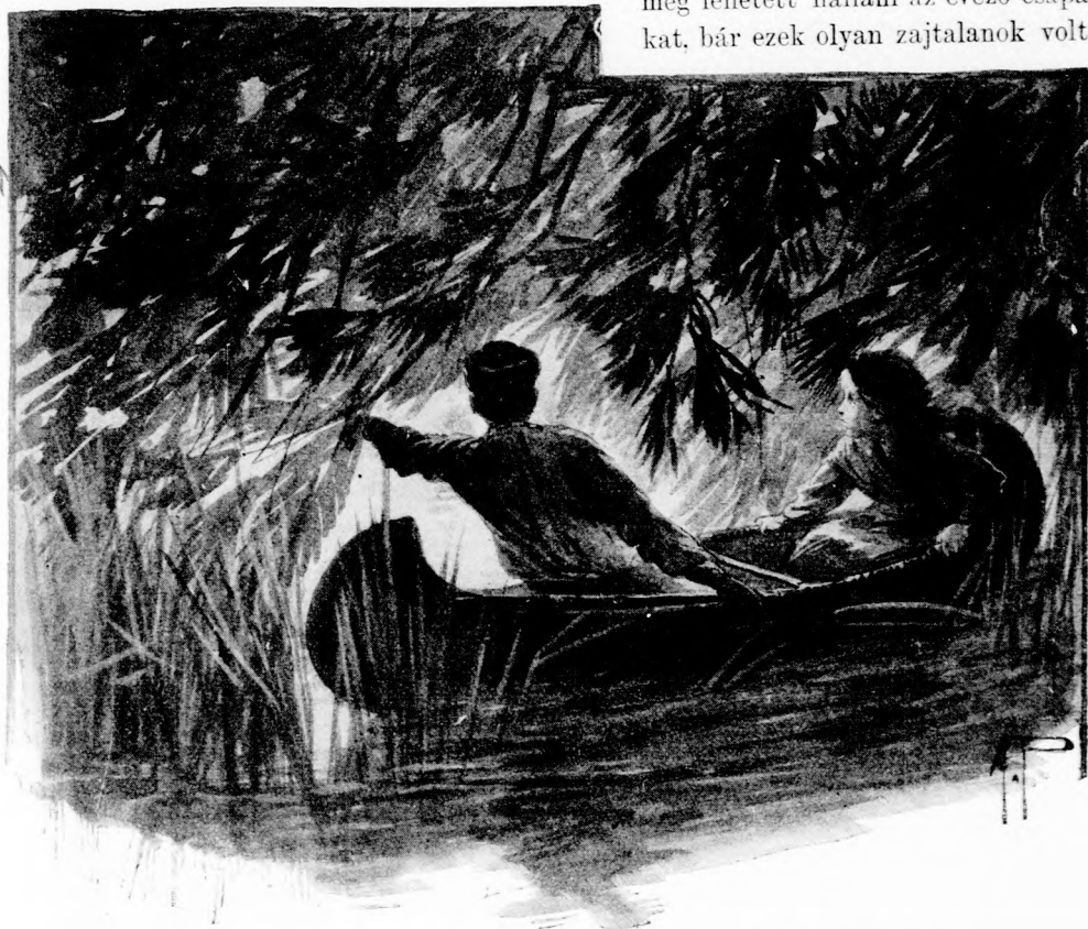
. . . FÉLKE HAJLITOTTA A LOMBOKAT. (Lásd a 326. lapon.)

Nagyon éles hallgatózással valóban meg lehetett hallani az evező-csapásokat, bár ezek olyan zajtalanok voltak,