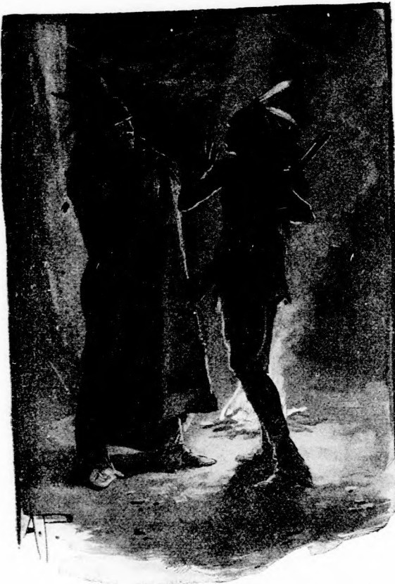
VÖRÖS-FARKAS . . . BESZÉLT A HARCZOSSAL. (Lásd a 323. lapon.)

igazat, sok má Rövid figyelés tudott meg. m — Csónako ahol mi jöttün