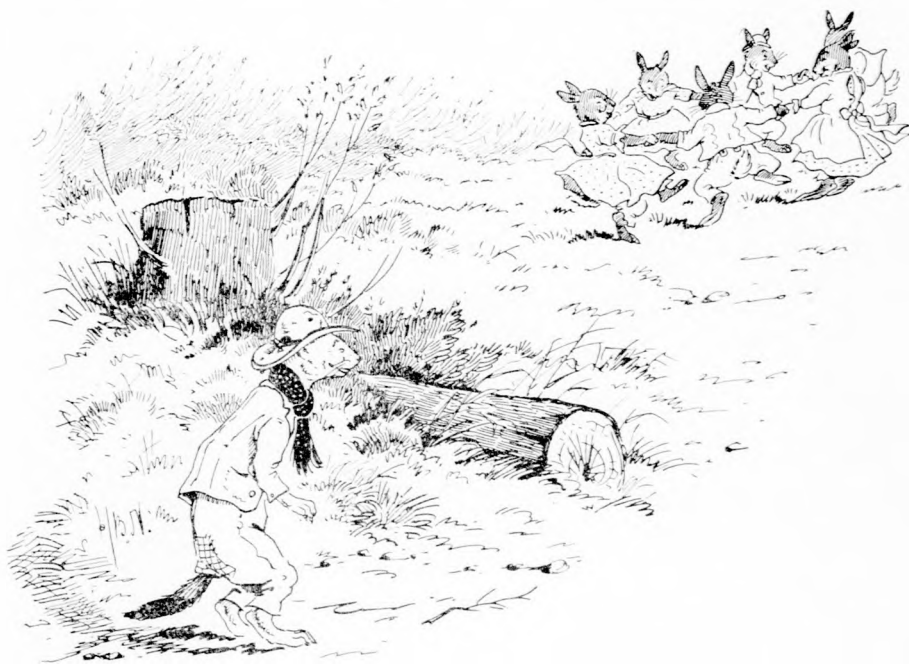
NYUSZIKA A TÁRSAIVAL TÁNCZOLT. (Lásd a 332. lapon.)

Végre nem is vitték magukkal vadászatra. Ámde, furcsa!... nyulpecsenyéhez