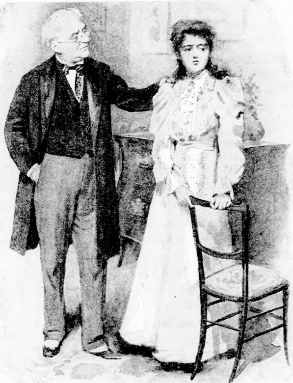
— BOHÓ VAGY, KEDVES LÁNYOM! (Lásd a 148. lapon.)