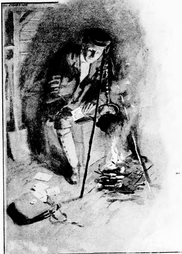
BÁLINT VOLT AZ. (Lásd a 150. lapon.)

nem is akart leskelődni, csak azt akarta tudni, mit süt-főz a kertész ebben a házikóban, ahol rendszeren csak kerti szerszám, virág-cserép s más efféle állott. A puha gye-