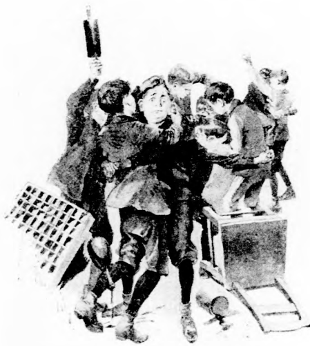
... PÜFÖLTÉK EGYMÁST.