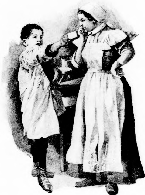
... FERKE ODA ADTA NEKI. (Lásd a 226. lapon.)

És így kész volt a vásár. Soha olyan dühösen még nem mentek egymásnak, mint most. A nagy dulakodásban felborult a gép s a bádóg doboz, amelyben a festék volt és a betű-szekrény. A festékes doboz a dulakodó fiukra talált esni és mire feltápszkodtak, kulimá-