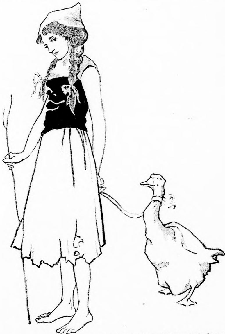
... EGY RONGYOS LIBA-PÁSZTOR LEÁNY. (Lásd a 239. lapon.)

kák adnak tojást, tollat, azt eladjuk a városban és az árán veszünk kenyeret. És ha tőlem öreg anyókatól tanulni is akarsz egyetmást, szívesen oktatlak.