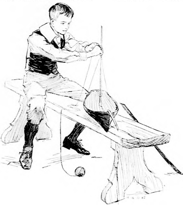
... FURT-FARAGOTT RAJTA. (Lásd a 242. lapon.)

Töprengése azonban nem tartott sokáig s mikor befordult az ablaktól, már igazán jó kedve volt újra. Hiszen nagyon egyszerű a dolog: mikor céljukhoz, a városba érnek, ott még nyitva lesz a postahivatal,