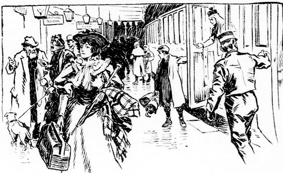
... HIVOGATTA VISSZA. (Lásd a 246. lapon.)

Leemelte a táskáját a podgyásztartó polczrul és diós patkót vett elő. Szelt belőle