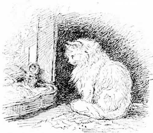
... MELENGETŐZTEM. (Lásd a 250. lapon.)

Egy napon, midőn Irénke a szobába ment, hogy a kanárit szabadon bocsássa, észrevétlenül utána lopóztam és gyorsan az ágy alá bujtam. Kivette a kalitkából a madarat, dédelgette, aztán szabadjáraeresztette, maga pedig távozott. Lesbe álltam. Az oktondi madár vigan csicseregve röpködött, de nagyon sokáig oly magasan fenn a szekrények tetején, hogy nem férhettem hozzá. Végre leszállt egyik székre: megjött a várt pillanat. Mohón szökkenem elő, egyetlen ugrással a széken termettem... hajh! hogy nagy iparkodásomban nem ügyeltem egyébre!... mert megragadtam ugyan a madarat, de ugyanabban a pillanatban már engemet is torkon ragadott valaki, még pedig Irénke, aki épp akkor tért vissza. Kész volt a baj.