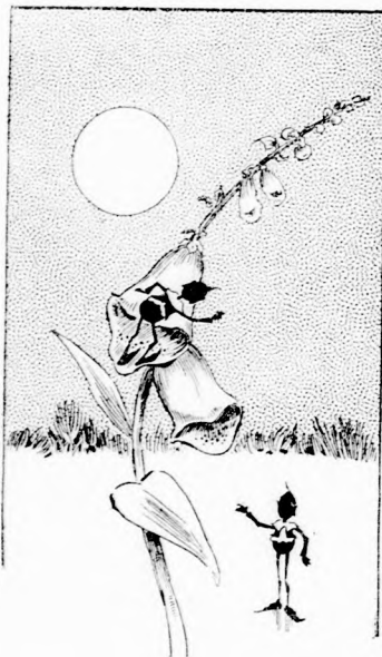
... FÖLMÁSZOTT A VIRÁGRA.

Volt eszök, hogy nem tették többször. A tündérke vigyázott a czipőcskéjére, a manócskák pedig mértéket tartottak a mókáikban és így vígan és boldogan éltek tovább.