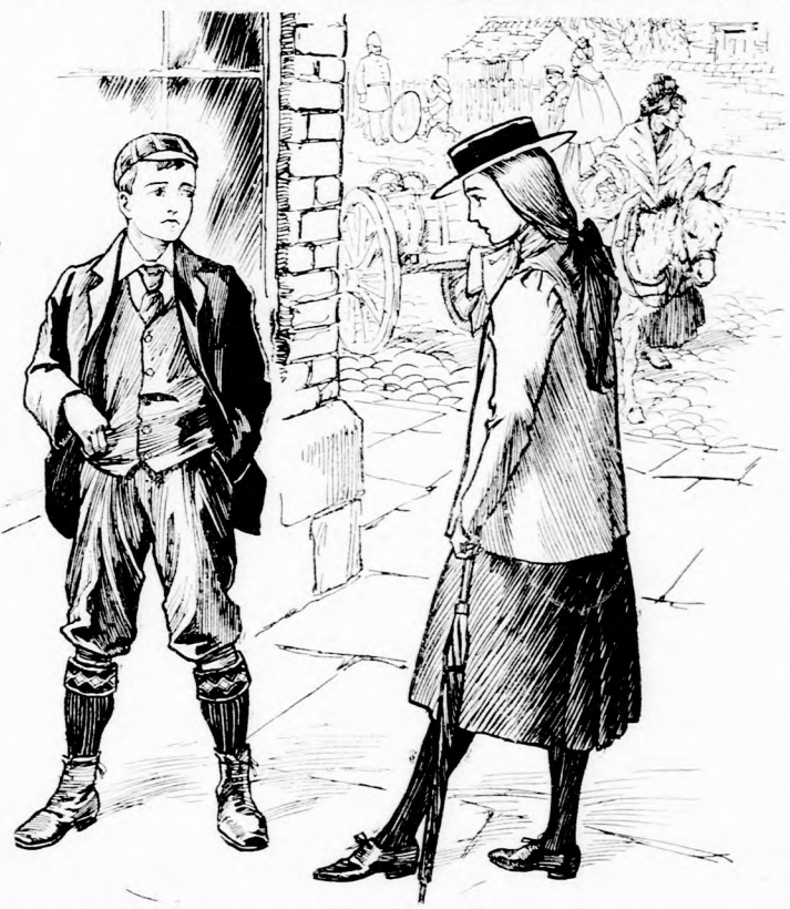
... VALAMI DOLGOD NINCS RENDBEN. (Lásd a 323. lapon.)