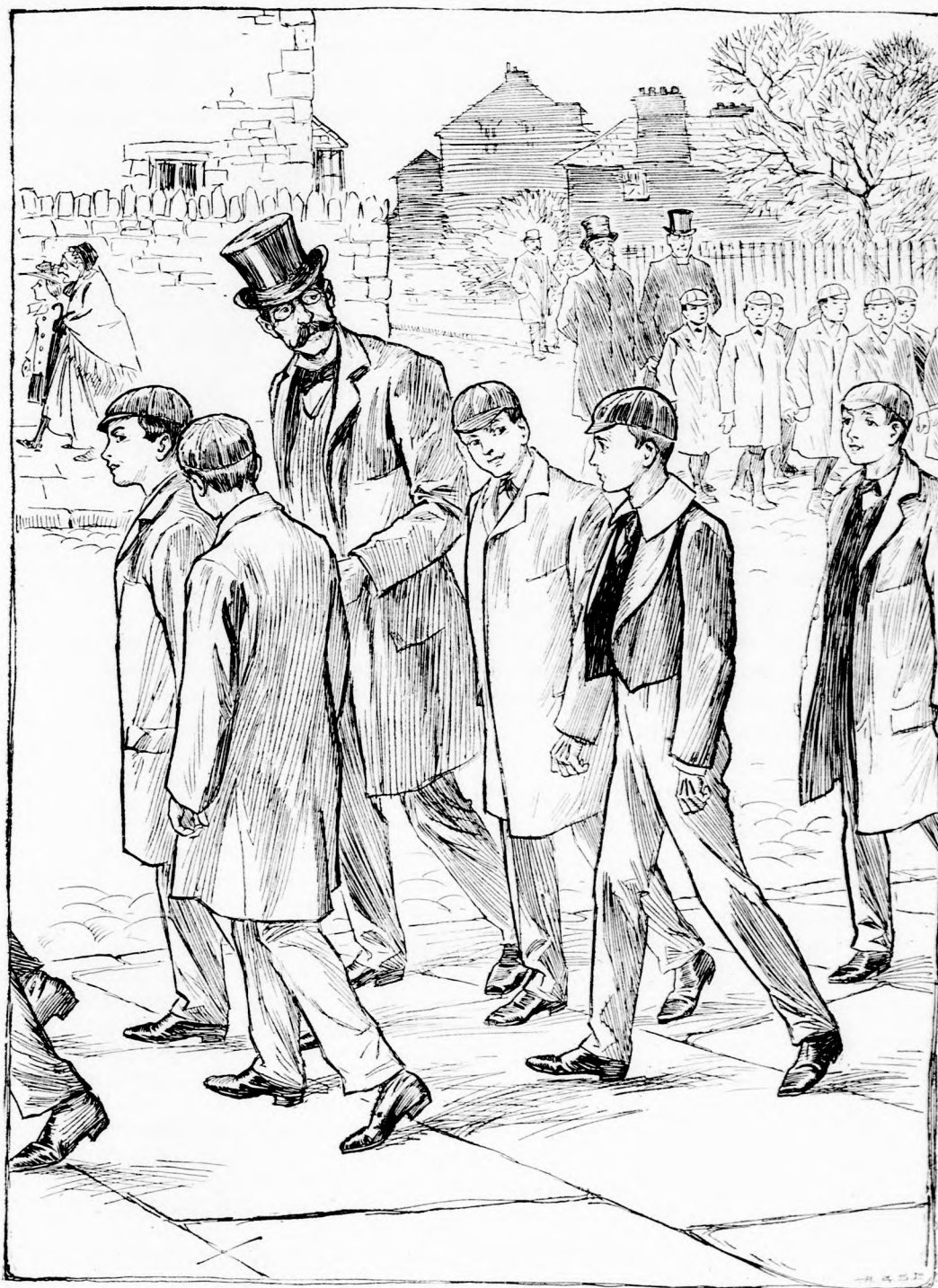
... A TANÁR MEGPILLANTOTTA. (Lásd a 326. lapon.)