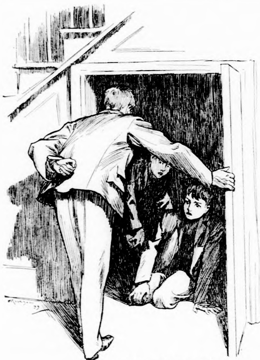
— BUJJATOK CSAK ELŐ! (Lásd a 355. lapon.)