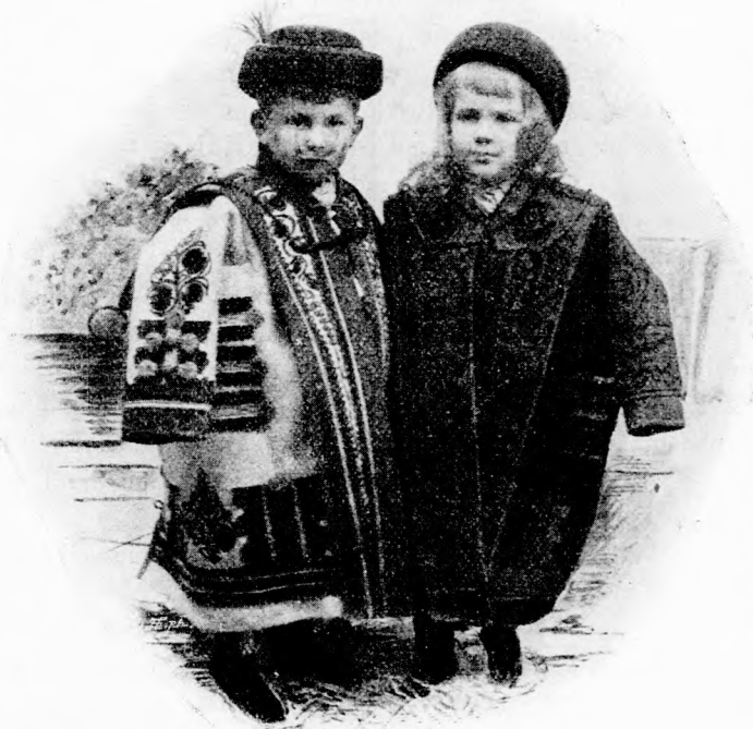
KÉT KIS MAGYAR. (Lásd a 359. lapon.)