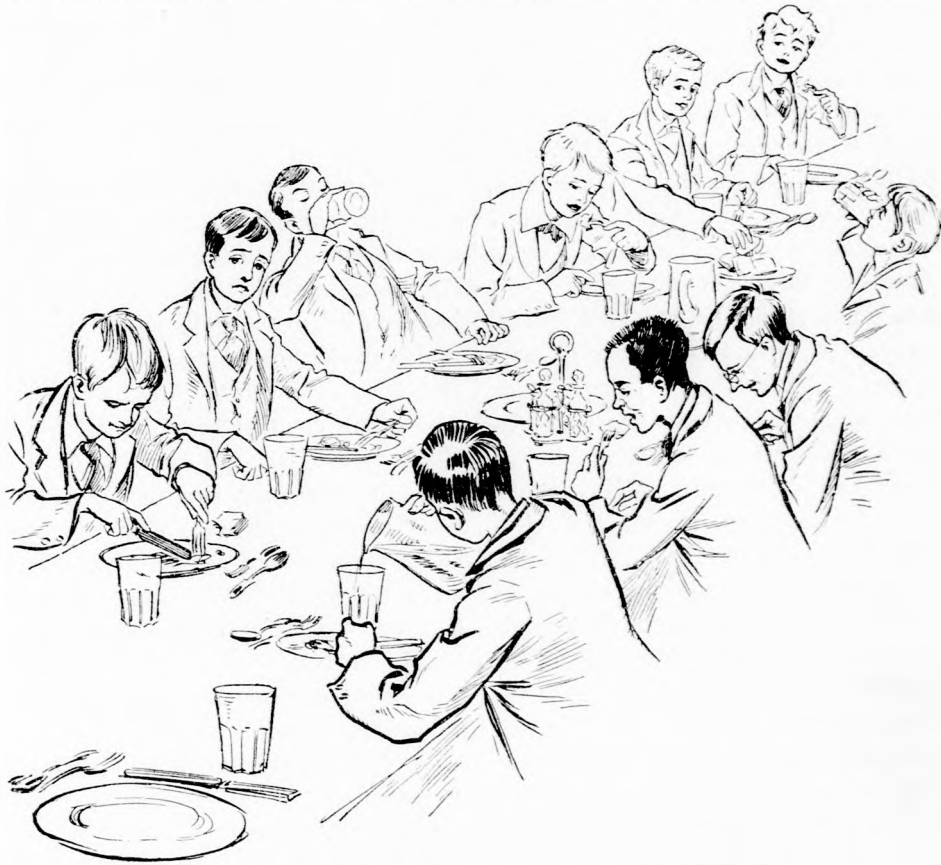
... VIGAN LAKOMÁZTAK. (Lásd a 356. lapon.)

Hát hogy ne mult volna el az étvágya! Hiszen a szoba-áristom és minden unalmas feladvány valóságos multság ehhez a véget nem érő zaklató bajhoz képest! Az