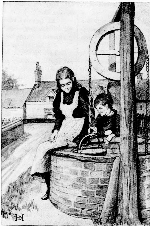
A KERÉKES KUTNÁL. (Lásd a 74. lapon.)

— Megvan annak az oka. Mikor királyunk a leányával köztünk megjelen, nem