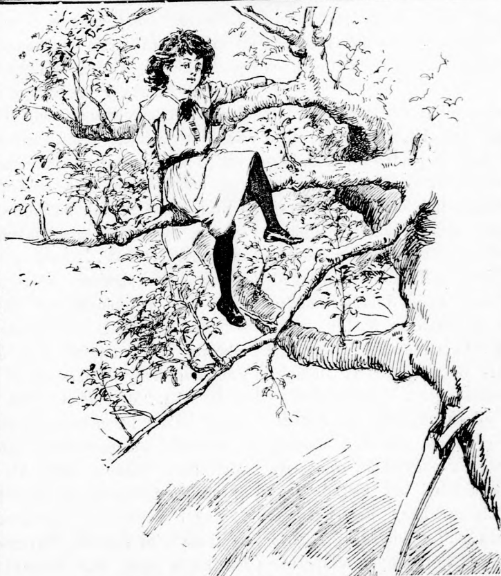
FÁRA MÁSZNI JÓL TUDOTT. (Lásd az 69. lapon.)