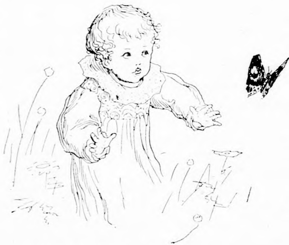
MEGFOGLAK! (Lásd a 71. lapon.)

Vissza lopózott mind a kettő a maga háló szobájába. Gabika Dezsővel aludt egy szobában, de nem köllött félnie, hogy a bátyja észre vesz valamit. Dezső, mihelyt lehajtotta a fejét a vánkosra, rendesen mélyen elaludt. Veronkának külön kis