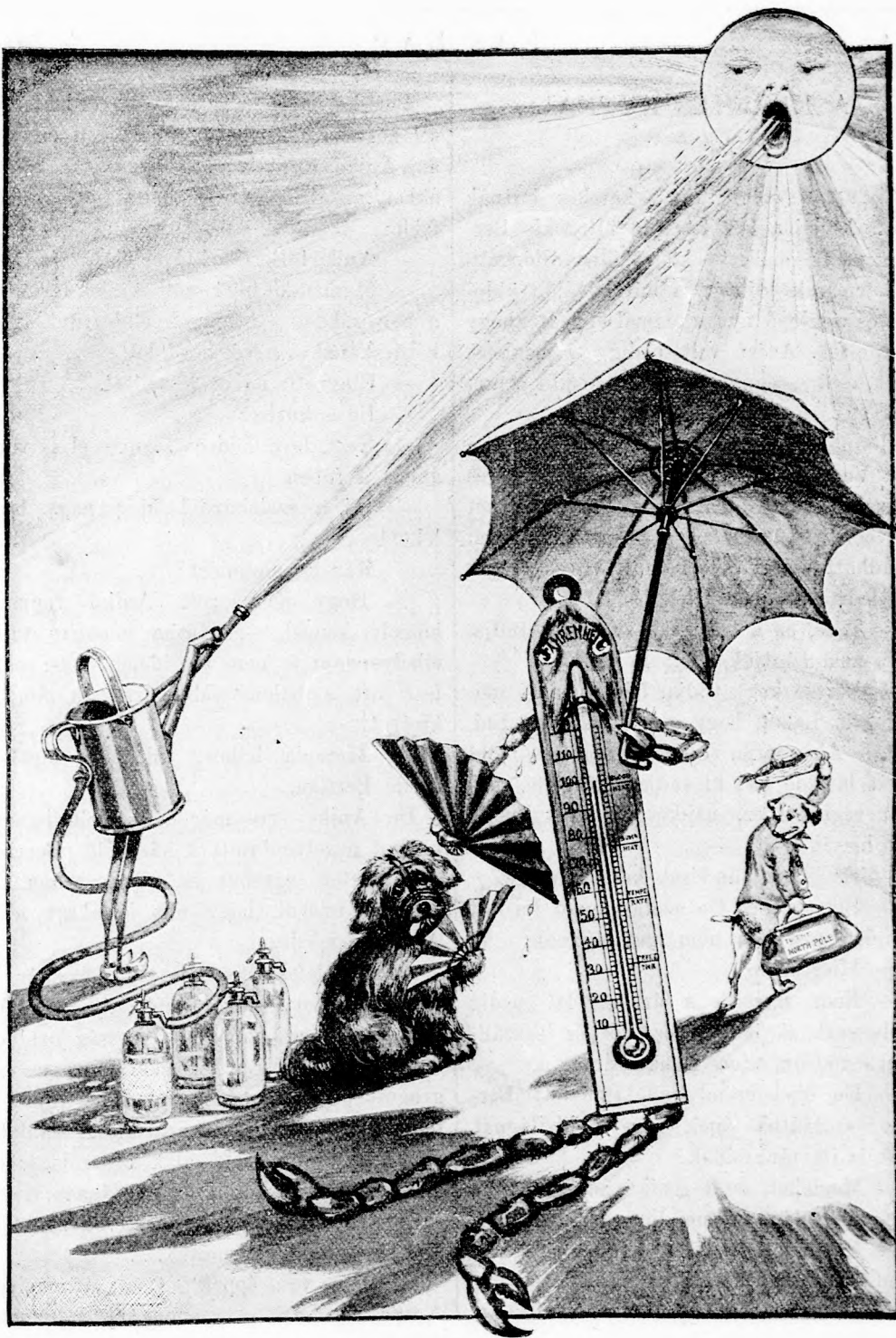
NAGY A MELEG! (Lásd a 71. lapon.)