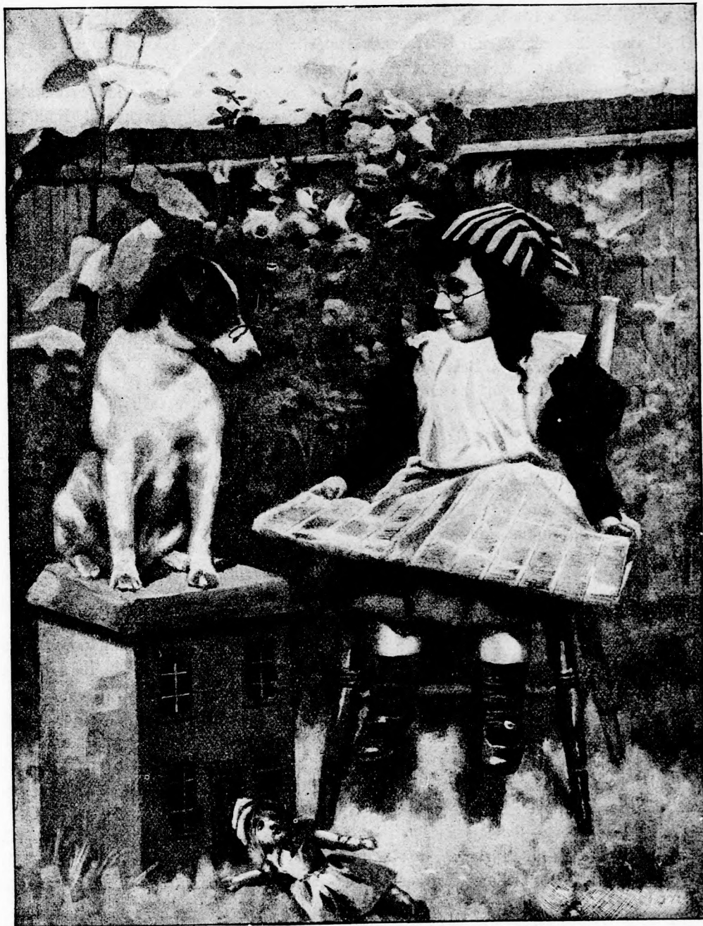
HOL A HIBA? (Lásd a 134. lapon.)