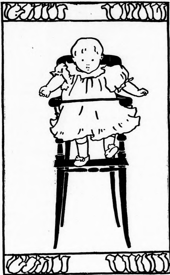
A KIS-KIRÁLY. (Lásd a 139. lapon.)

nem tombolt olyan vad indulat, lassacskán mégis össze szedte az eszét és mikor Veronka már abba hagyta a sirást, így szólt hozzá: