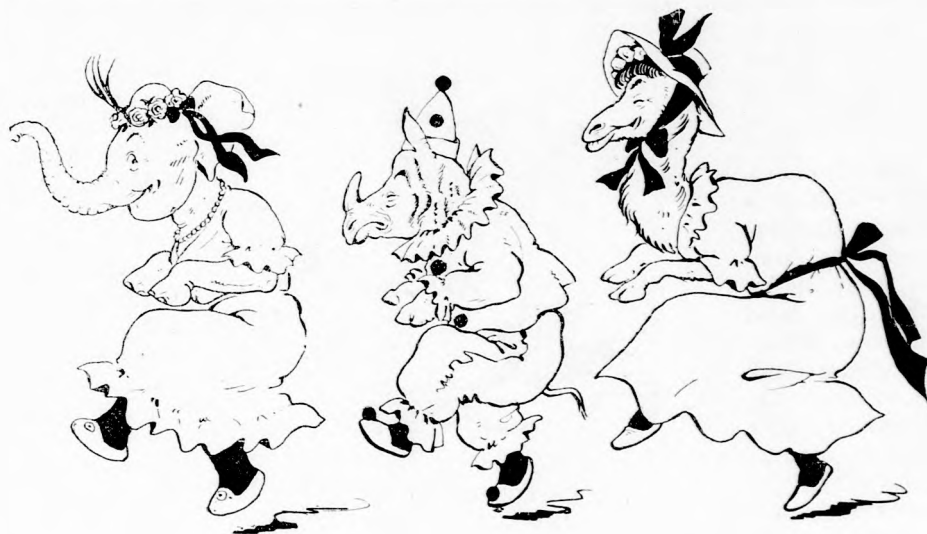
... UJRA MEG UJRA PRÓBÁLTAK.

Es ha még csak a szónál marad! De mikor szereplő társai nem lejtettek a ked-