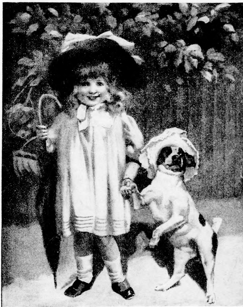
VENDÉGSÉGBE. (Lásd a 130. lapon.)