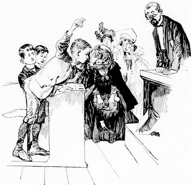
... FINCZIKE MEGUGROTT ... A GRÓFNŐ ÖLÉBE.

igaz volt, hogy Ferke látott délelőtt egy embert motoszkálni egy hidacska alatt, mikor a vasuthoz ment. De az az ember nem tett oda tárczát, hanem egy katulyát, melyben egy kis fekete cziczának a teteme volt. Ferke onnan tudhatta azt, mert ő maga kíváncsi volt és utána kutatózott, mit is rejtettek oda? Bezzeg meghökken, midőn látta azt a »kincset«. Csak