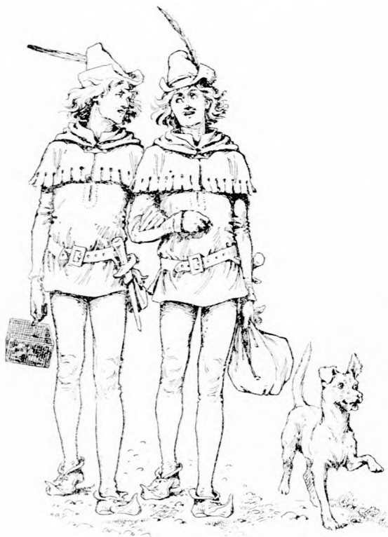
... A KÉT IFJU MEGINDULT.