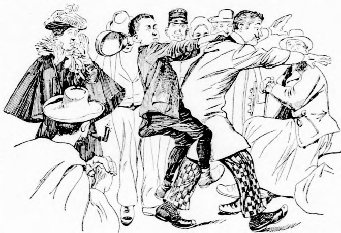
... KÖRÜL FONTA A LÁBÁVAL

Nem volt baj! Megháltak a városban, aztán reggel tovább utaztak.