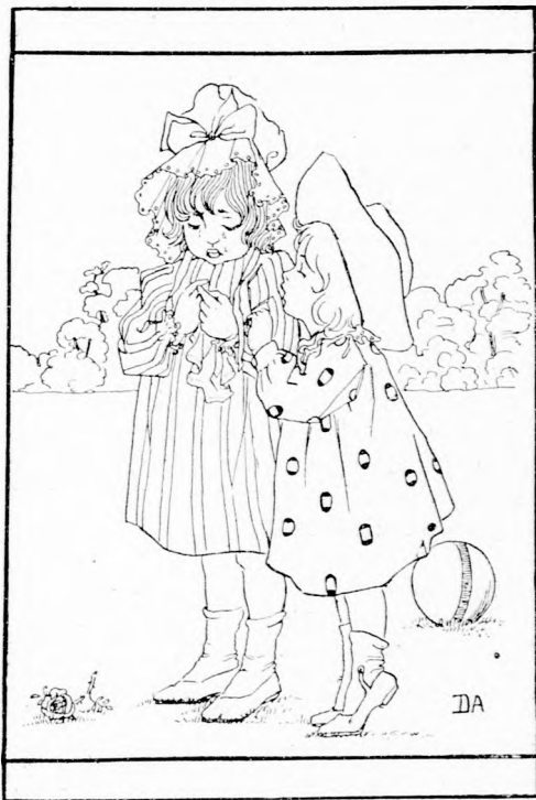
... MEGSZURTA AZ UJJÁT. (Lásd a 255. lapon.)

— Nem tudom, azt nem hallottam. De azt mondta, hogy már többször látta az urfit és ő ugyan nem hiszi, hogy az urfi