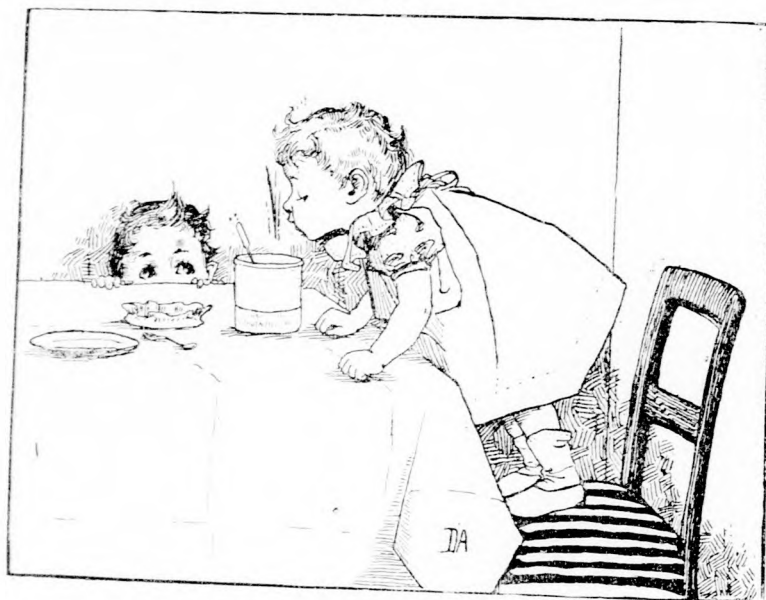
... BELE KUKKANTOTT AZ ÜVEGBE.

— Akkor jól van. Szeretem, hogy álltok a szavatoknak. No, meg is jutalmazlak. Adok még ebből a czukorba főtt gyümölcsből.