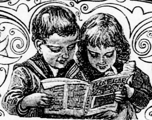
Szerkeszti Forgó bácsi.