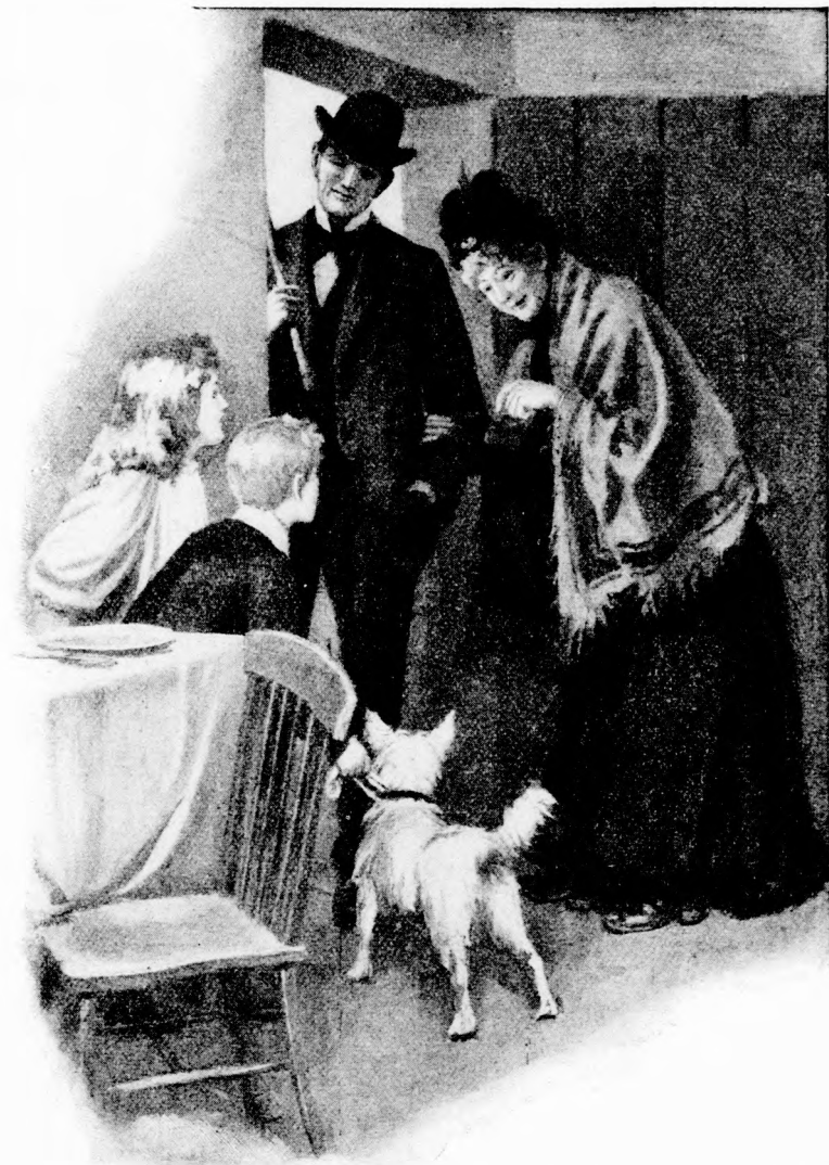
ITTHON VAN A KEDVES MAMÁTOK? (Lásd a 355. lapon.)

A két testvér nem nagyon vig képet mutatott, de bele nyugodott. Csakhamar