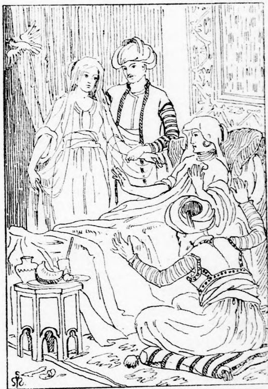
... EGY LÁNY ÁLL AZ AHMED FIU ELŐTT. (Lásd a 15. lapon.)

dig, míg egy arany hegy elé nem érnek. Itt volt a negyven tündér birodalma. »Ha majd meglátják a hajódat — oktatja a varju — mind meg akarná nézni az a negyven tündér. Te be ne engedd őket, csak a leges-legszebbiket, a király-