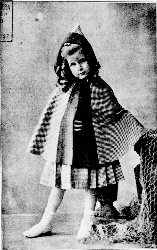
LILLI. (Lásd a 11. lapon.)

M. F. MUZEUM KÖNYVTÁRA H. Új Nap Könyvtár Pécs 2. 460 sz.