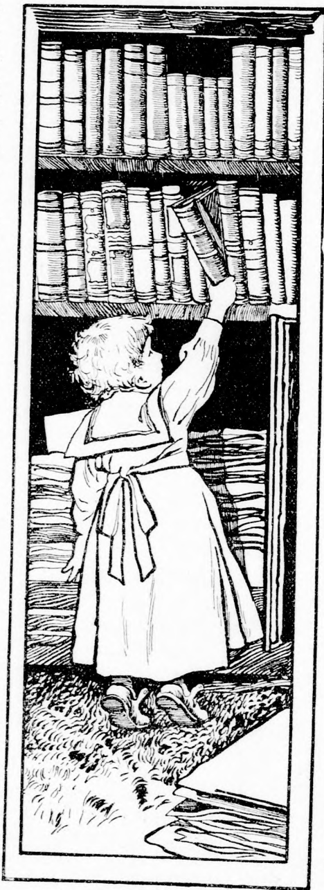
MÁR BELÉJÜK IS MARKOLT. (Lásd a 31. lapon.)

— Fikom adta piros hurkái! Mi van a bögyötökben?