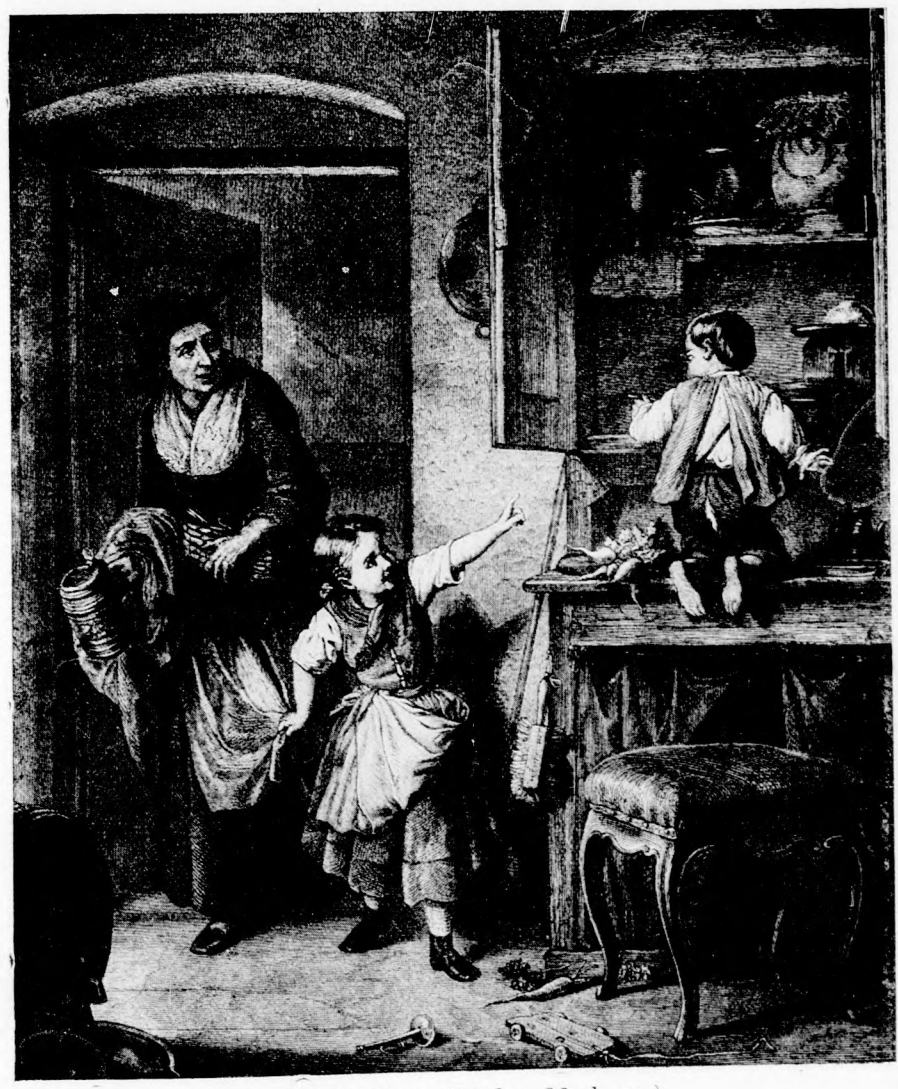
A KIS TORKOS. (Lásd a 22. lapon.)