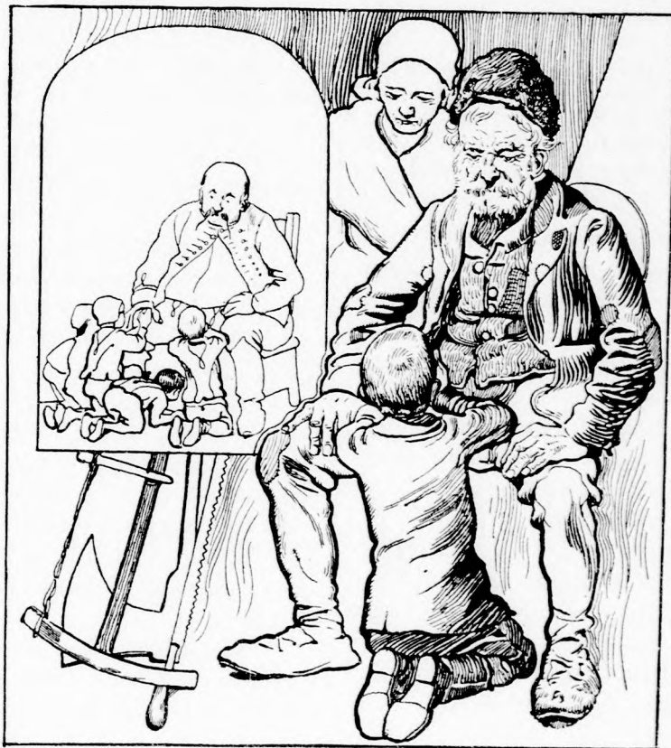
PALKÓ ODA BORULT AZ ÖREG RMBER LÁBAIHOZ. (Lásd a 26. lapon.)

— Adjon Isten jó estét, néném asszony! Az öreg néne ijedten lépett hátra.