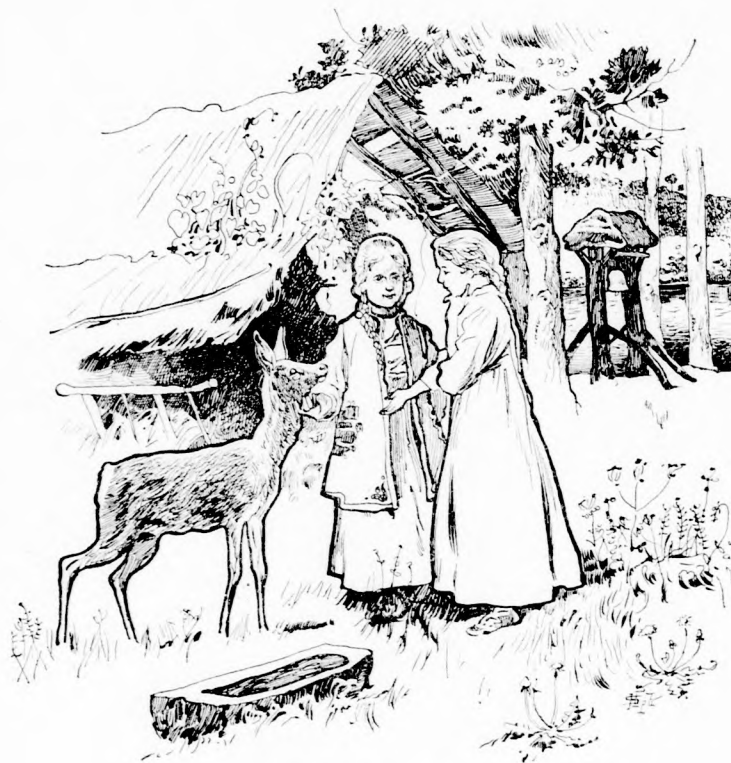
... NÉZD EZT A KEDVES KIS ÁLLATKÁT.