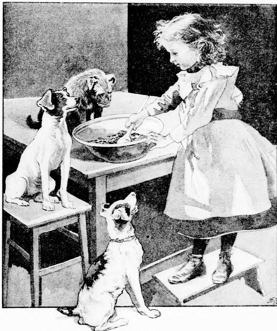
A KIS GAZD-ASSZONY. (Lásd a 71. lapon.)