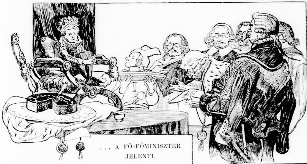
... A FŐ-FŐMINISZTER JELENTI.

— Felséges uram! Azon tanakodunk éppen, hány méter magas legyen a kő-fal a folyó-partján? Nem tudunk megegyezni. Határozzon Felséged!