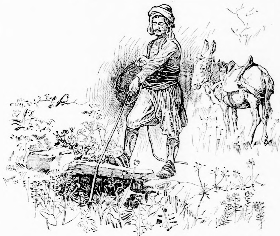
... KÖTELET LEERESZTI A KUTBA. (Lásd a 108. lapon.)

Azzal elő vesz a sátán három fa-levelet. Cziprus fának volt a levele. Oda adja a favágónak és így szól: