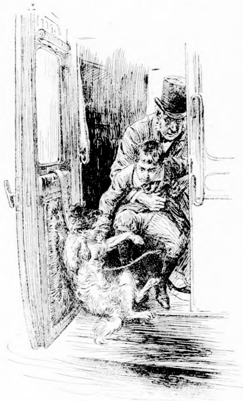
... AZ ÖRVÉNÉL MEGKAPTA.

A vonat most már teljes erejéből haladt és majdnem kiért az állomásból. Pista végre kinyitotta az ajtót és amikor a vonat éppen a perron végéhez ért, a feléje szökkenő kutyát az örvénél megkapta, befelé