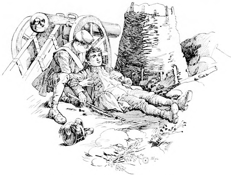
... TÁRSA SIMOGATTA, VIGASZTALTA. (Lásd a 247. lapon.)

Az osztrák szörnyü öldöklést vitt végbe azokon a védtelen hazafiakon, akiket keze