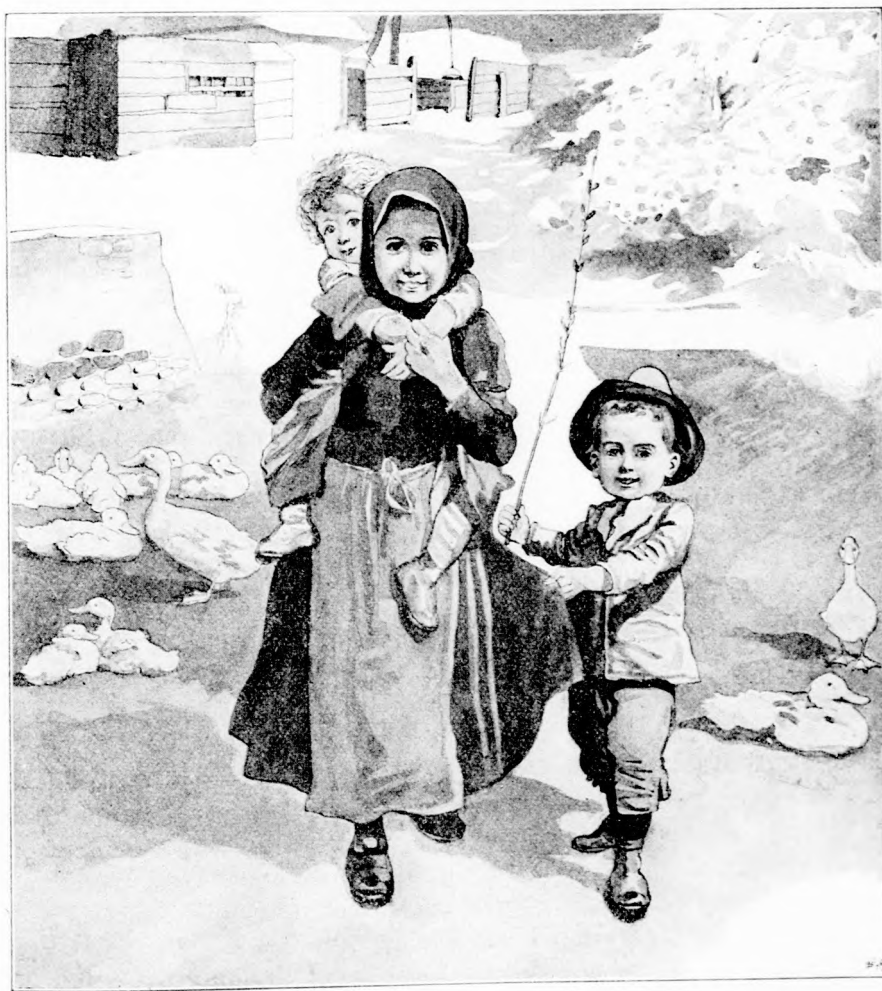
GYI TE GÖZÖS! GYI KATINKA . . . (Lásd a 244. lapon.)