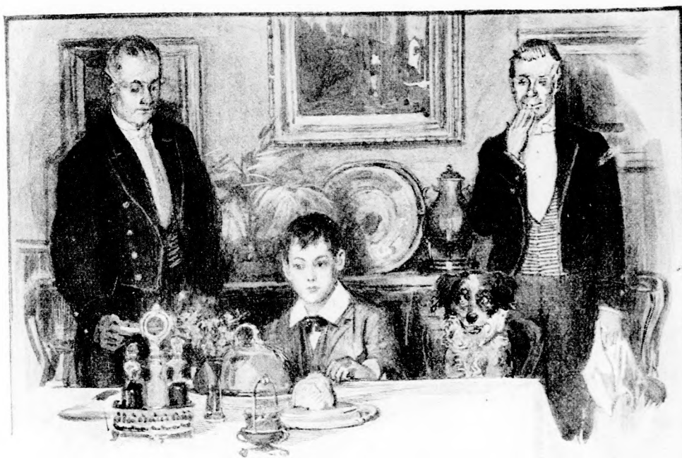
... KÉT INAS ÁLLT A HÁTA MÖGÖTT. (Lásd a 274. lapon.)