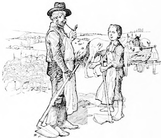
A MAJSZTRAM ELBÁMULT EKKORA MERÉSSZÉGEN. (Lásd a 285. lapon.)

De nagyon csalatkozott. A majsztram újra befogta a Fakót és a Csillagot a szekérbe és felültette Palkót maga mellé a kocsis-ülésre. Félénken kérdezte: