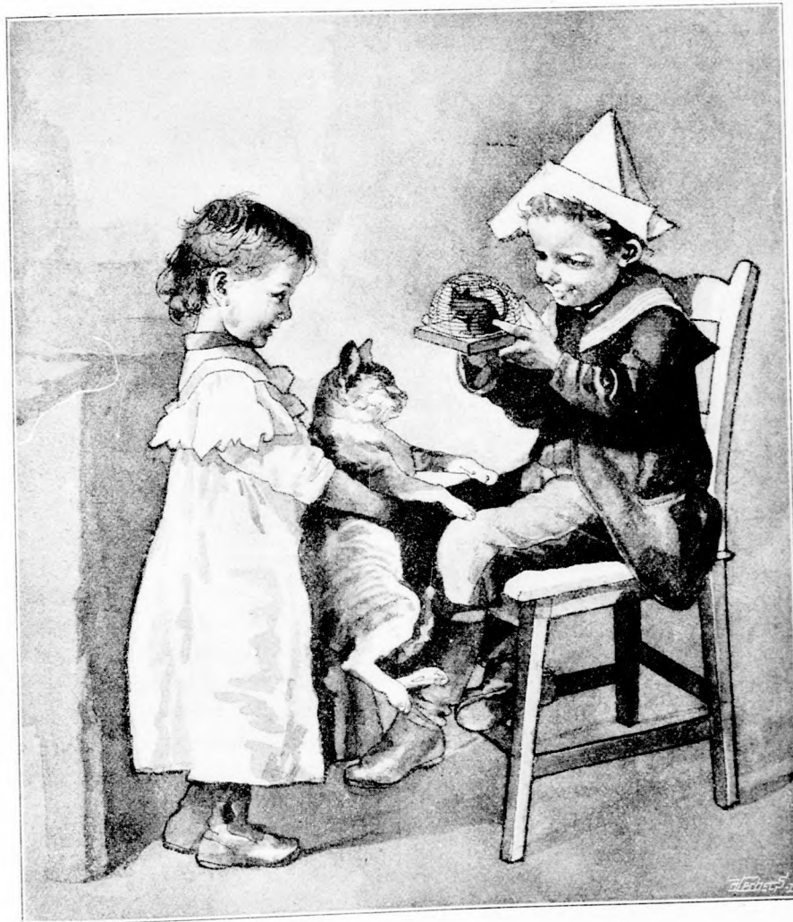
KÖLL-É EGÉR? (Lásd a 277. lapon.)