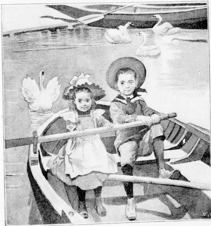
UTAZÁS. (Lásd a 293. lapon.)