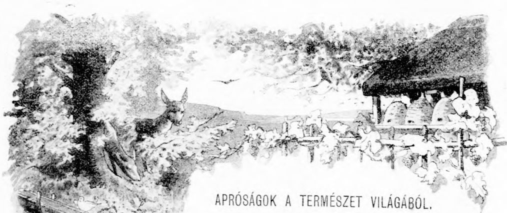
APRÓSÁGOK A TERMÉSZET VILÁGÁBÓL.