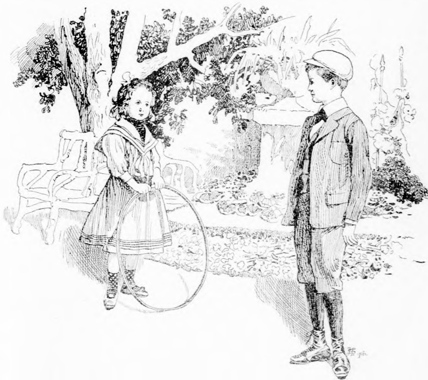
KICSI, GÖMBÖLYDED LÁNYKA ÁLLT ELŐTTE. (Lásd a 292. lapon.)

— Na, ez csak amolyan képzeletbeli eltérés volt, felelte Horváth ur. Sohasem láttam még azt az urat és jól meg is kell majd fizetnem, hogy eljőjön. De fiu, annyit mondok, hogy senki előtt, még Török