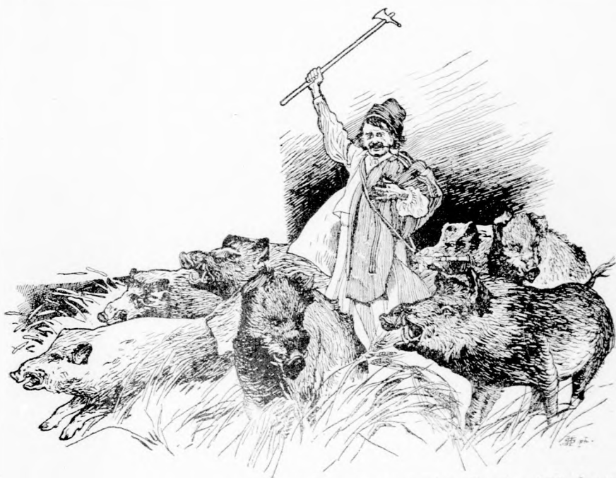
A SZÉP ARANY-KALÁSZOS VETÉST MIND LEGÁZOLTÁK. (Lásd a 300. lapon.)

Nosza minden bástyára új ágyukat, minden örtoronyba új katonákat rakott.