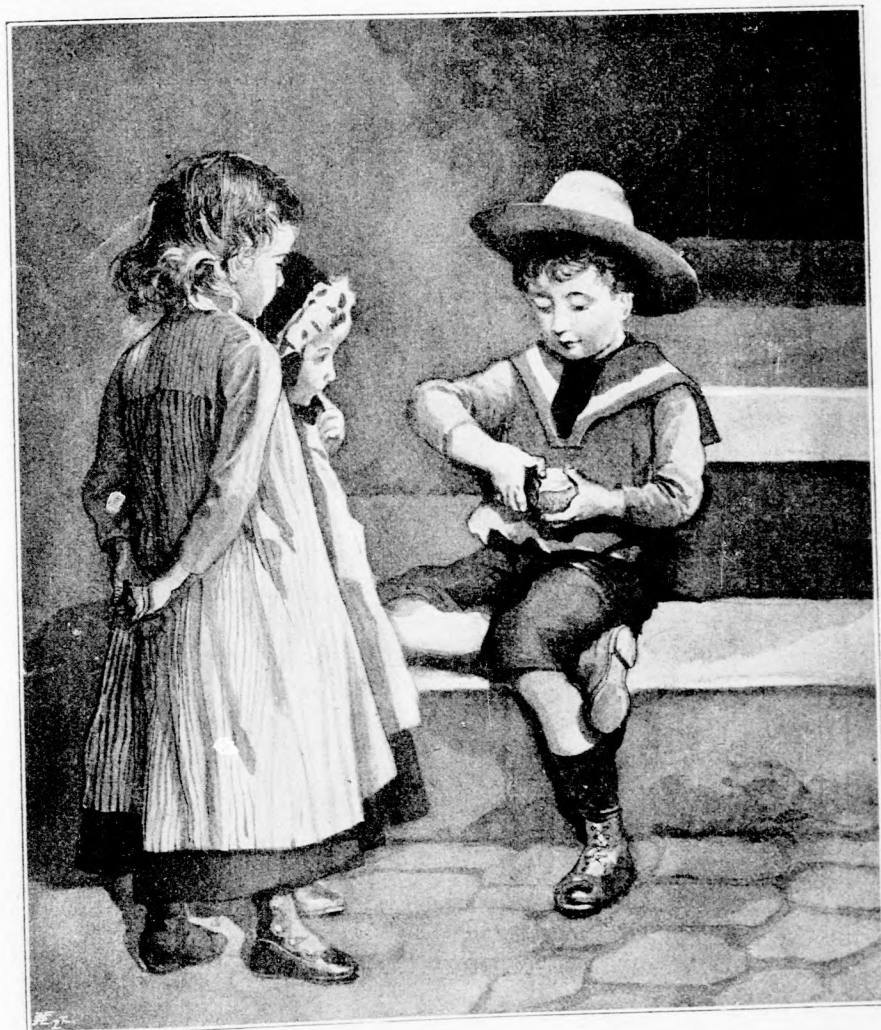
OSZTOZKODÁS. (Lásd a 308. lapon.)