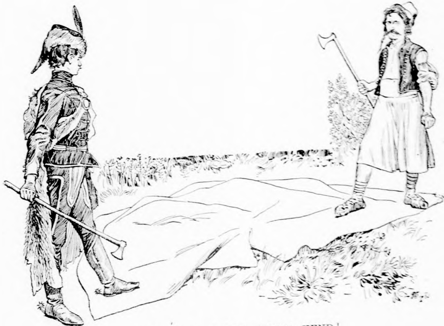
— NO, OTT A BALTA, FOGJA KEND!

kihozott onnan egy hosszú nyelű fényes baltát. Azt megforgatta az öt ujján a levegőben s aztán egy hajítással bele vágta egy arasznyi széles bükkfába, amelyik volt tőle legalább is negyven lépésnyire.