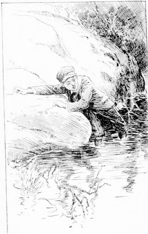
... A SÁR FELFRÖCSSENT. (Lásd a 306. lapon.)

Ezzel felkapta a cipőjét és kiszaladt a házból, míg Vörös a szitkok özönét zudította utána. Mikor Pista leült Vigyáz mellé, hogy felhuzza a cipőjét, elgondolkozott azon, amit Vörös mondott. (Folyt. köv.)