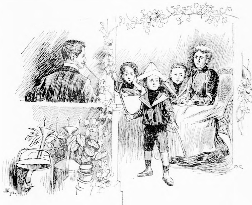
... KIRÁNTOTTA A KARDJÁT.

— Hát te, Gyuszi? kérdezte az apa a másik gyereket, akinek még most is az oldalán volt fényes bádogg kardja.