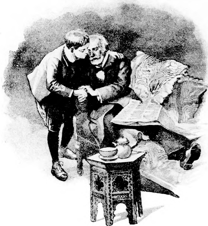
... ÁTÖLELTE ÉS MEGCSÓKOLTA. (Lásd a 324. lapon.)

— Talán, fiam; de nem ígérhetem meg, mert öreg vagyok, s néha nagyon fáradt-