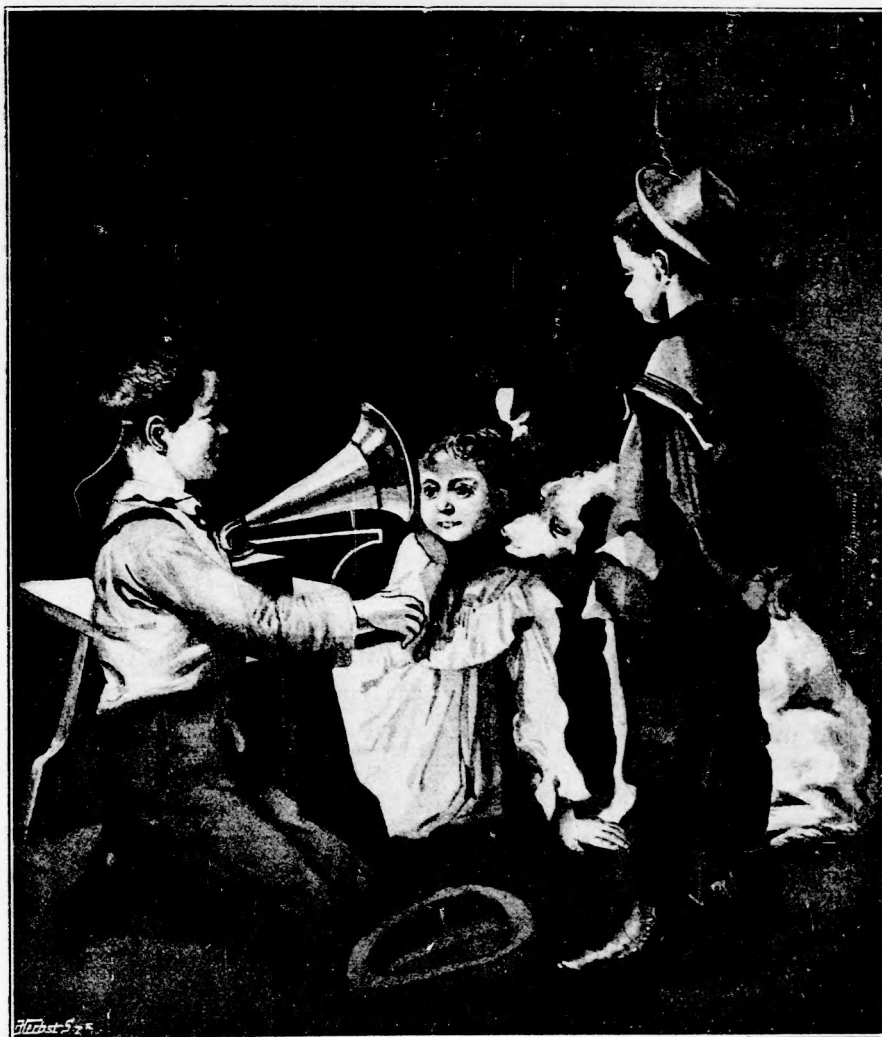
ÖRDÖNGÖS MASINA. (Lásd a 324. lapon.)